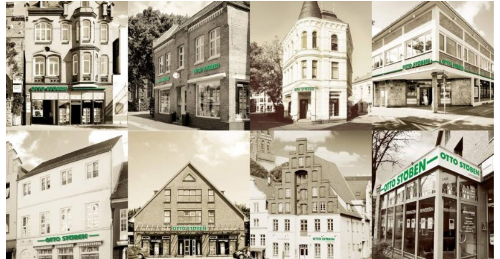
Abschlussbild Fotomontage neu