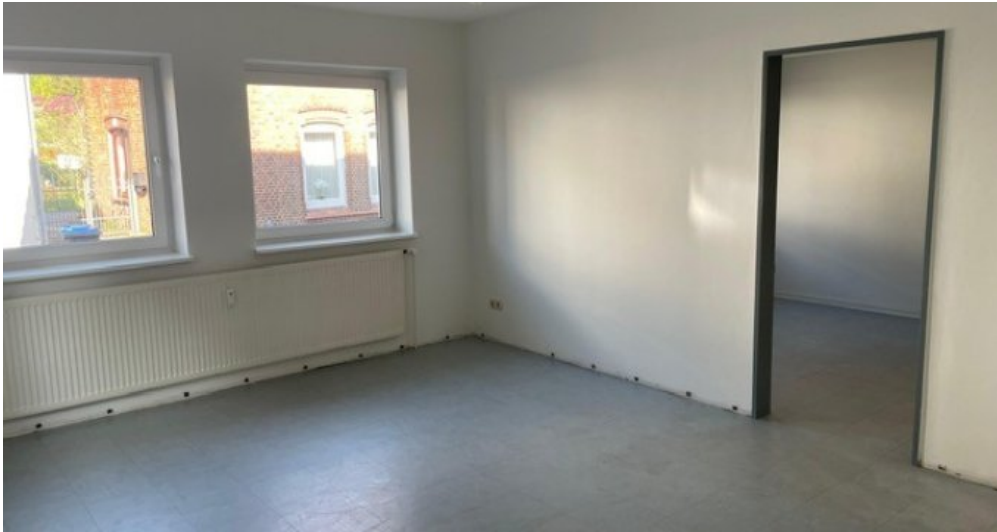
0356 Blick zum Schlafzimmer