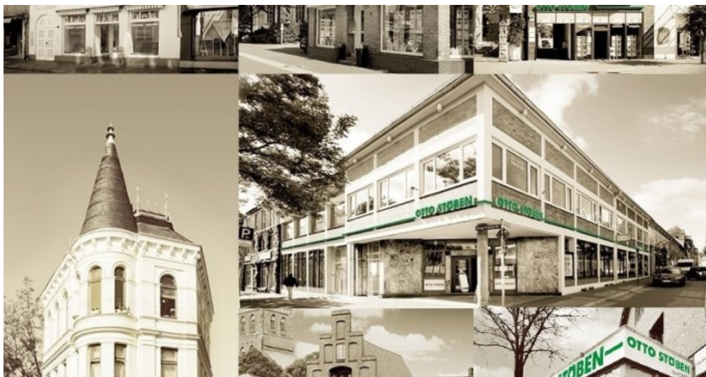
Otto Stöben GmbH