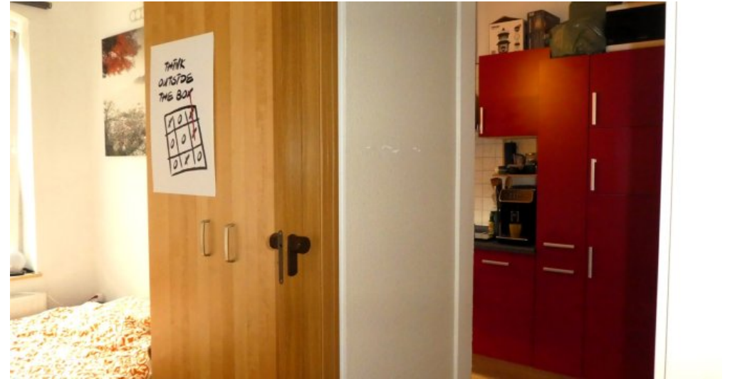
Vorflur Schlafen + Küche