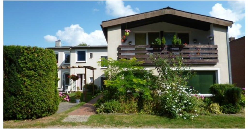
Haus mit Anbau