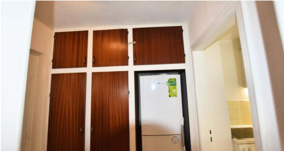
Flur mit Einbauschränken