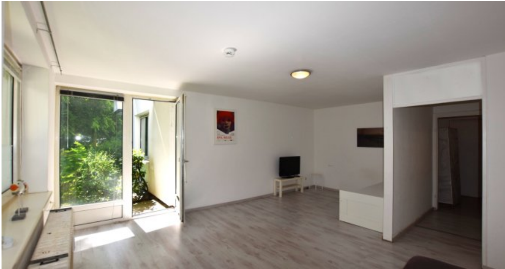
Wohnzimmer mit Terrasse