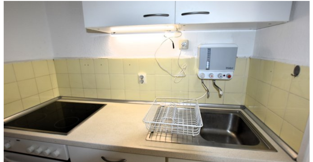
Küche weitere Ansicht