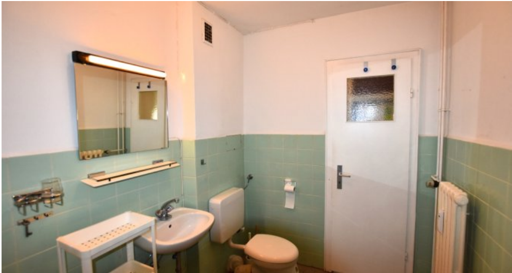
Bad weitere Ansicht