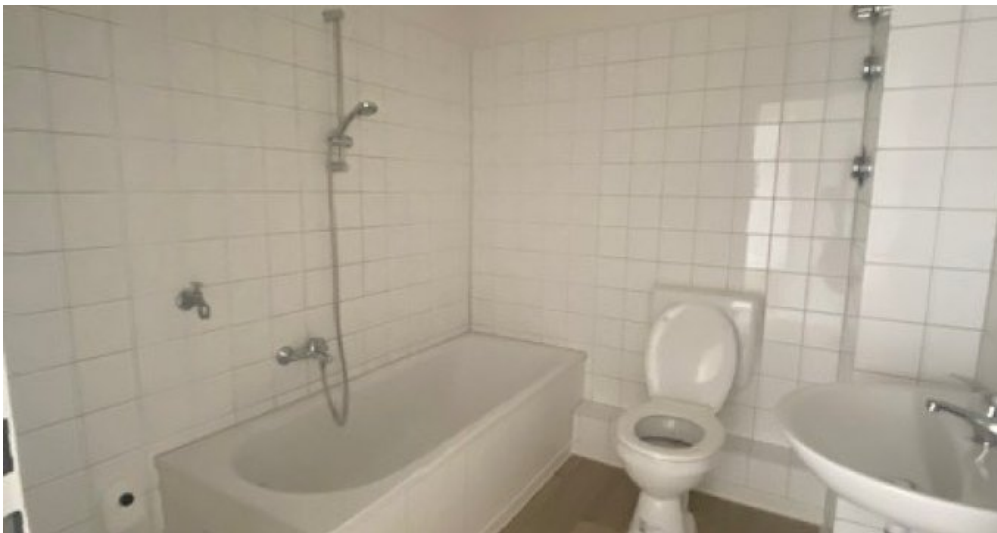
ES 13 Bad