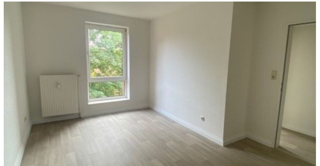
ES 13 Zimmer