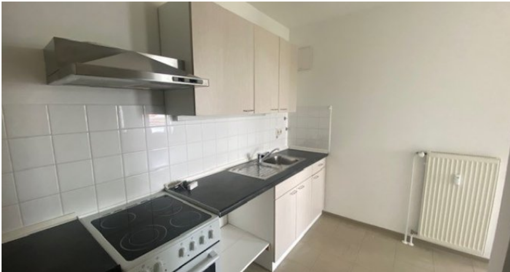
Küche weitere Ansicht