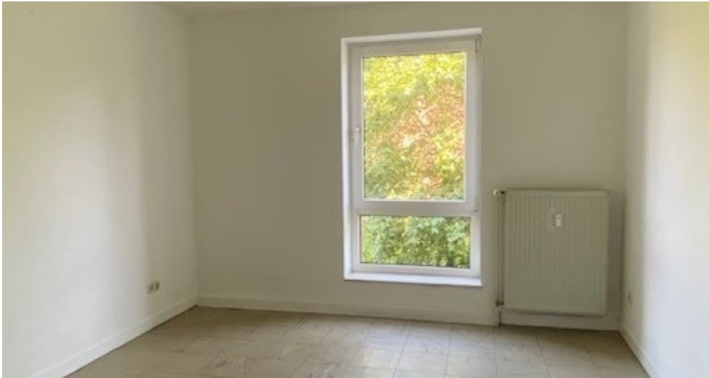
ES 13 neu SZ