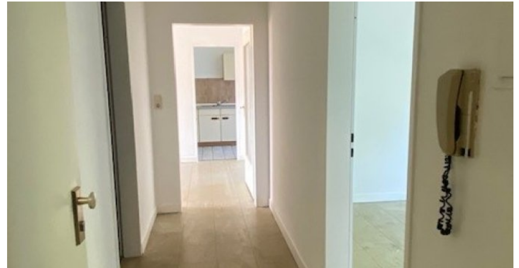
ES 13 neu Flur