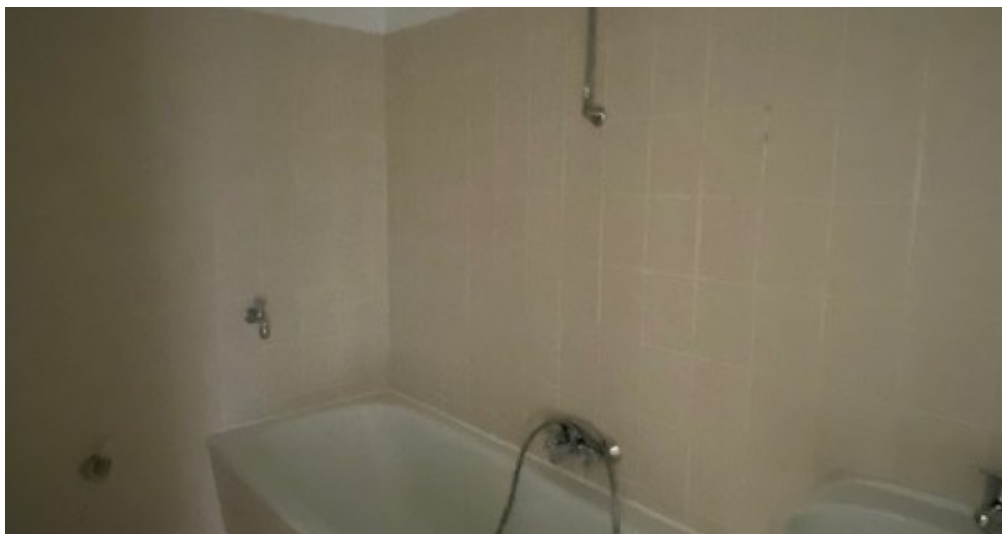
ES 13 neu Bad