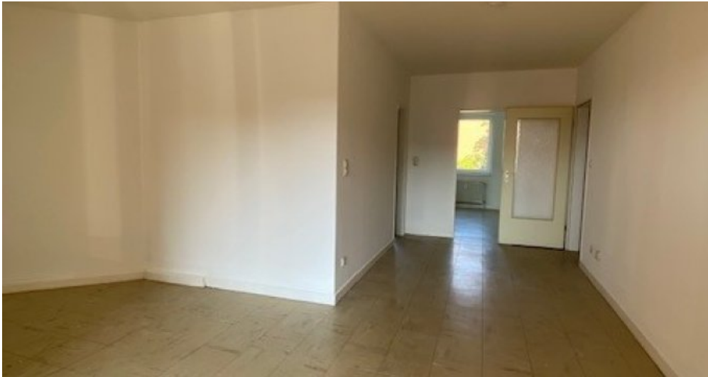
ES 13 neu Wohnzimmer Blick zu