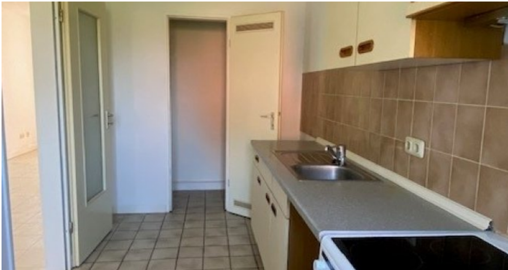
ES 13 neu Küche 2. Ansicht