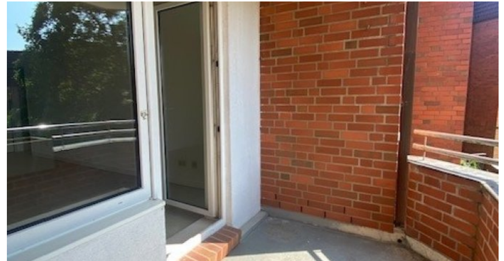
ES 13 neu Balkon 2. Ansicht