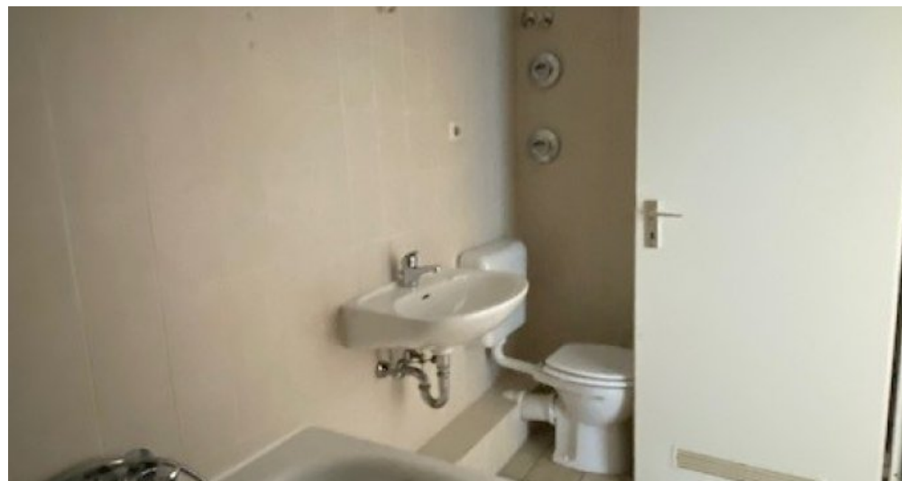
ES 13 neu Bad 2