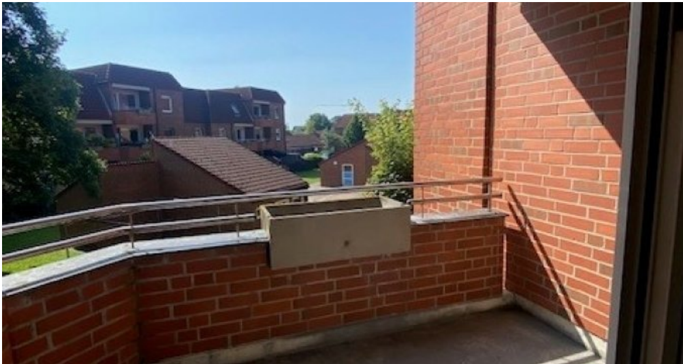
ES 13 neu Balkon