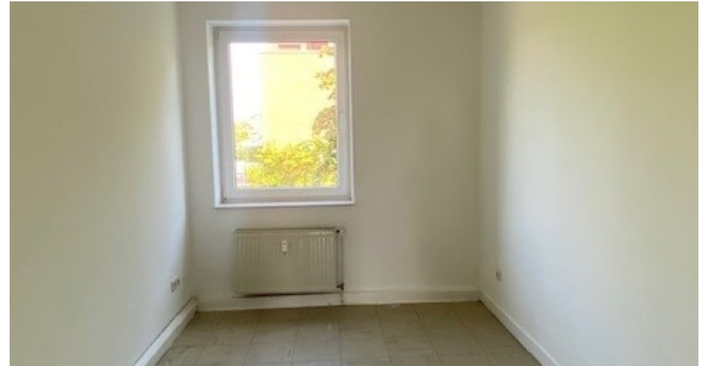
ES 13 neu KZ