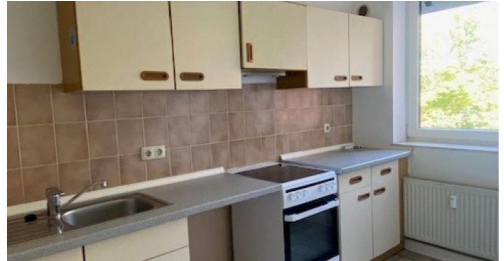
ES 13 neu Küche