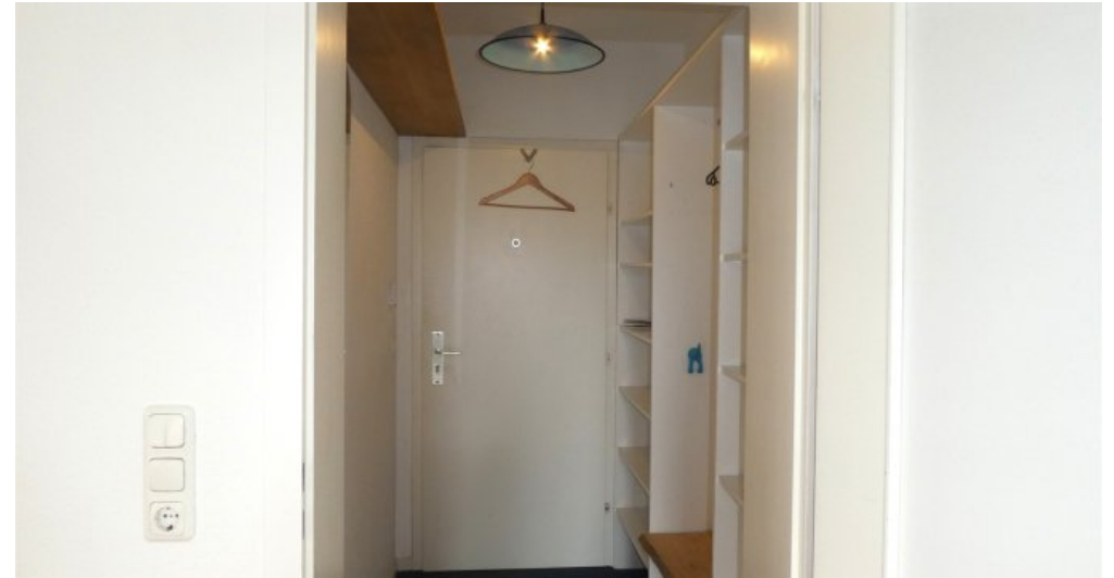
Eingang mit Garderobe