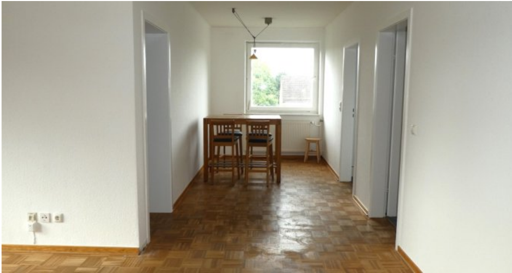
Wohnzimmer mit Essplatz