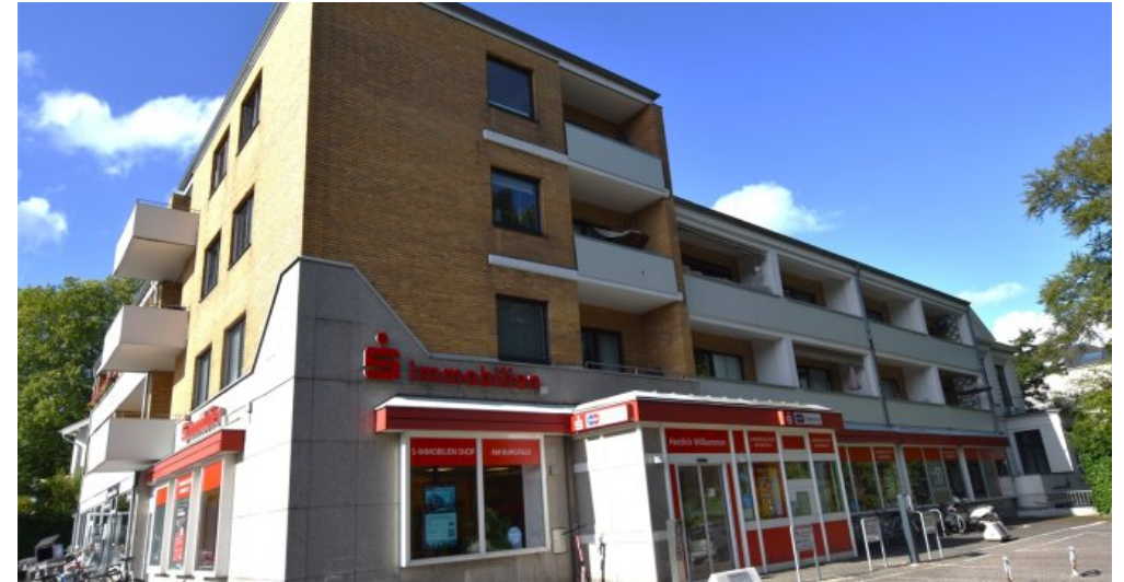
Ansicht v Parkplatz bear