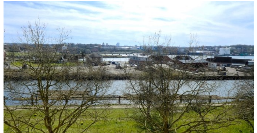
Blick auf N-O-K vom Wohnzimmer