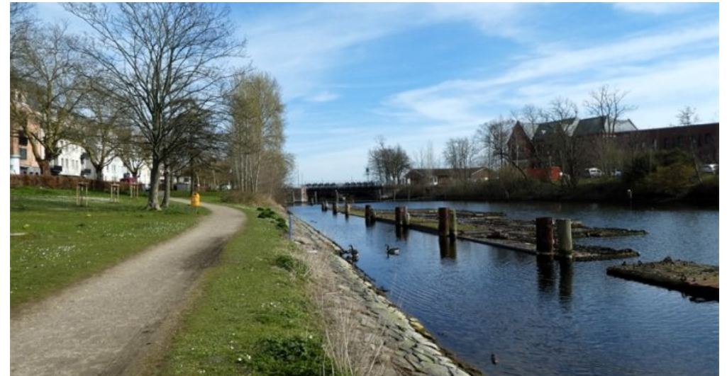
Wanderweg am Kanal