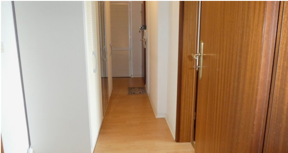
Flur mit Abstellkammer