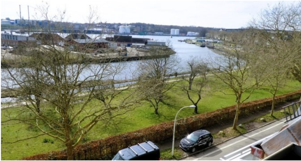
Blick auf N-O-K vom Wohnzimmer