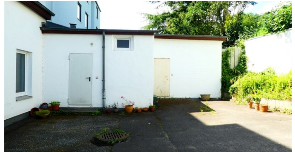
Innenhof mit Anbau