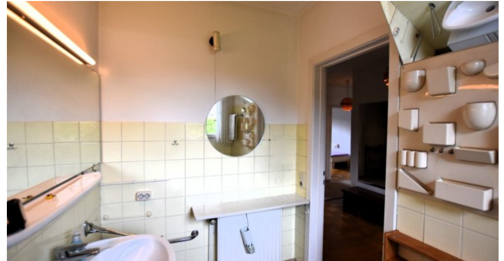
Badezimmer weitere Ansicht