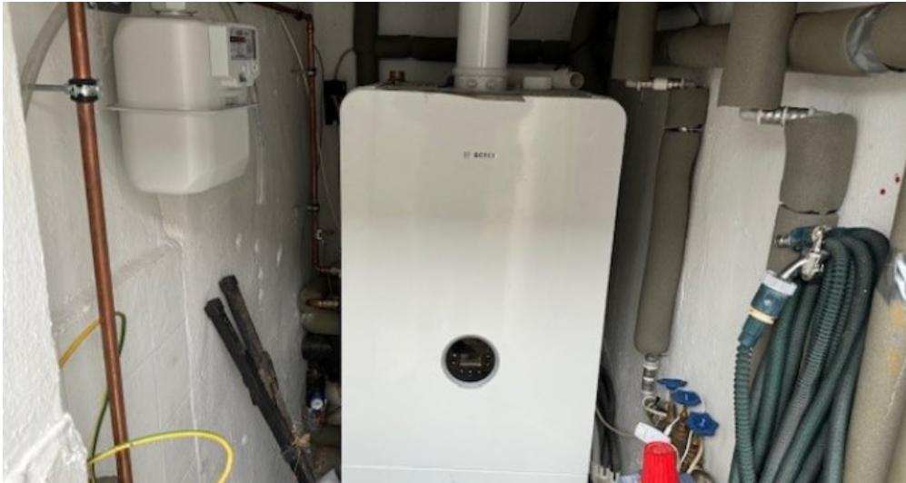
Gasheizung von 2019