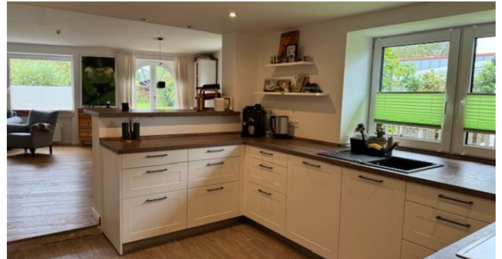
Küche EG 2