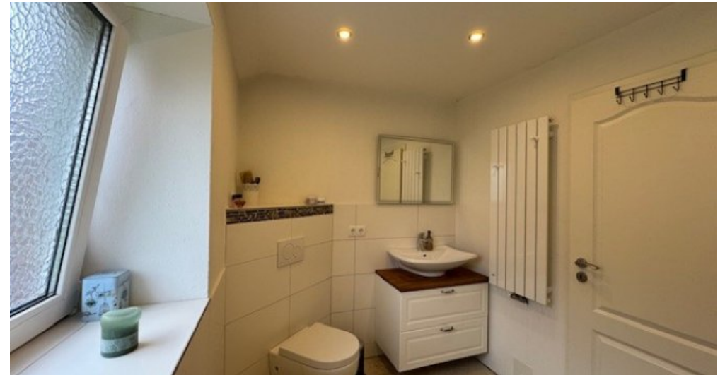
Bad EG 2