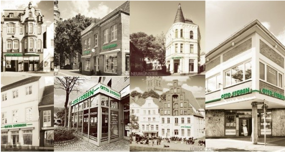
Abschlussbild OTTO STÖBEN