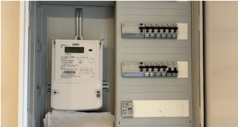
Sicherungsschrank von 2019