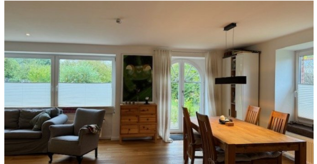
Wohn Essbereich EG