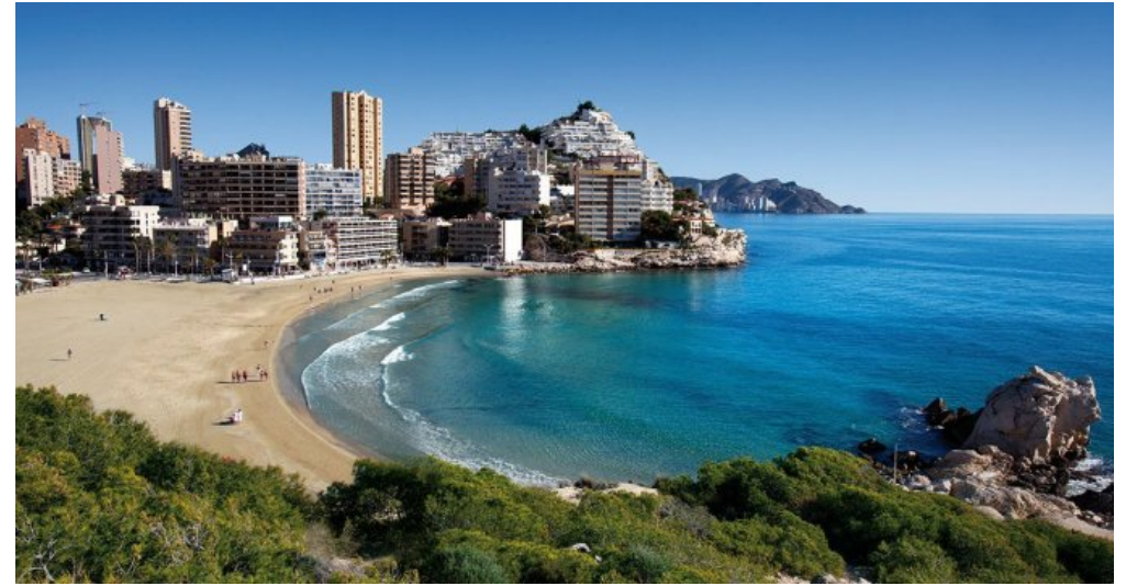
Townhouses / Adosados