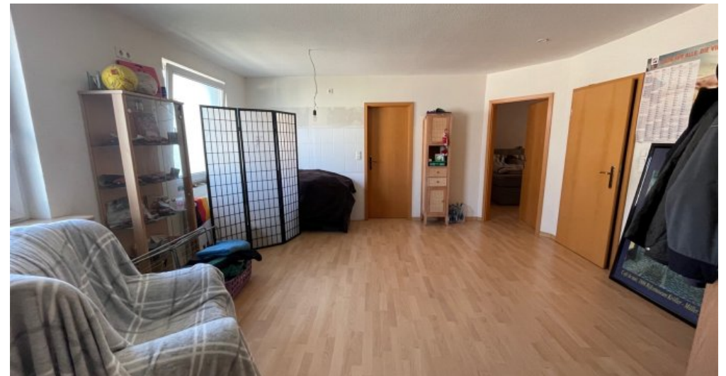
Arbeitszimmer 1. OG