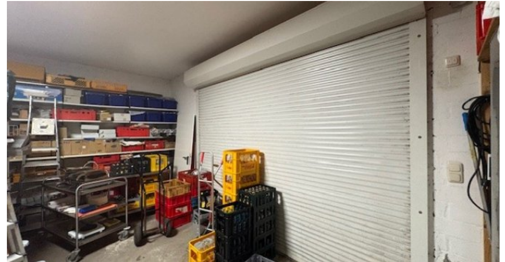
W Lager Garage