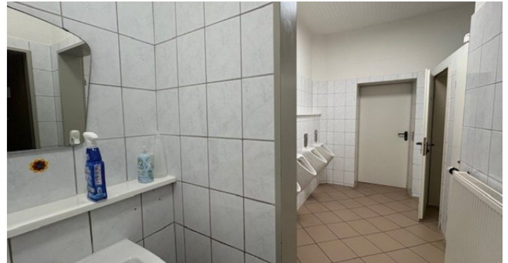
W Sanitär male