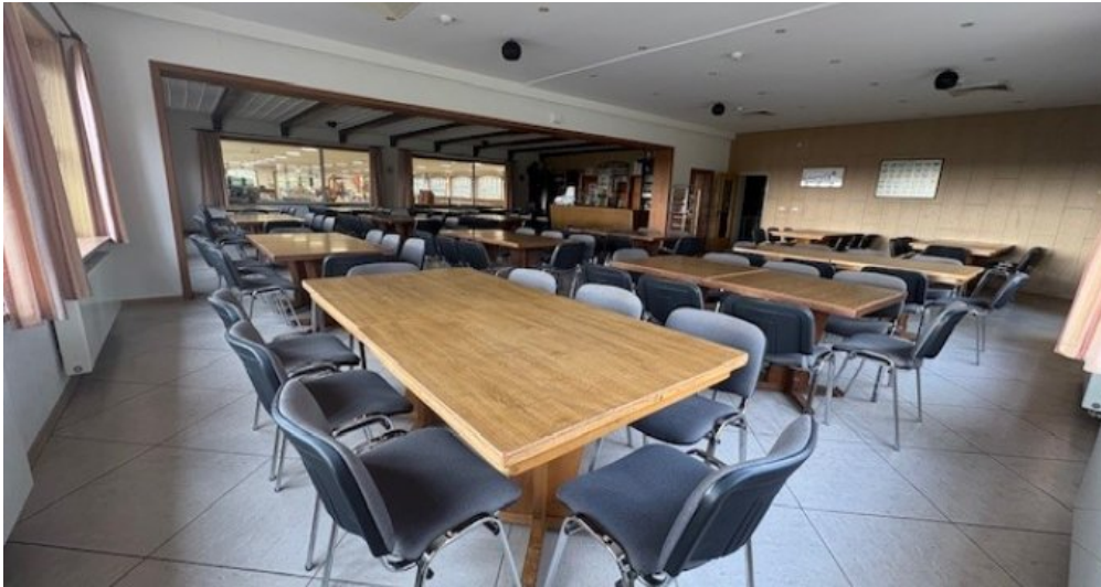
W Gastro 3