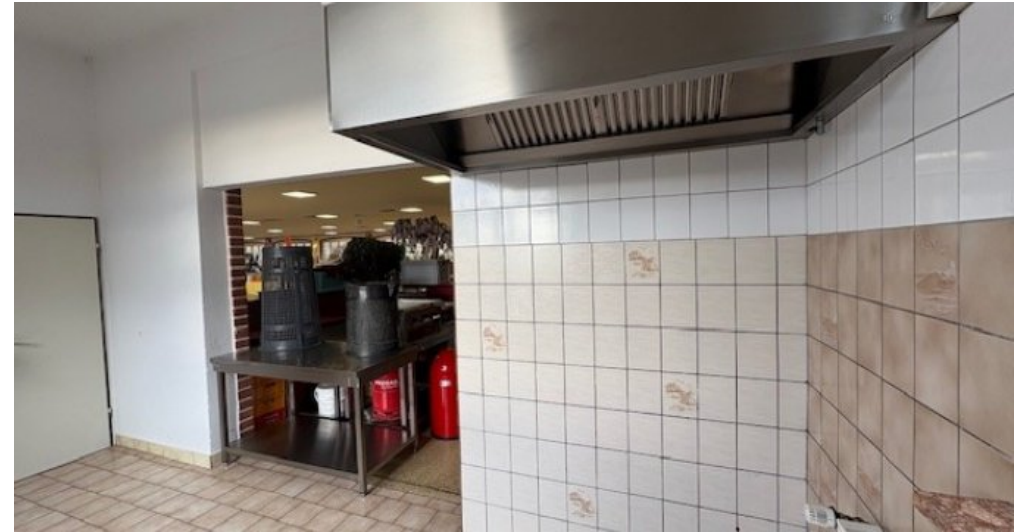
W Küche Foyer 2