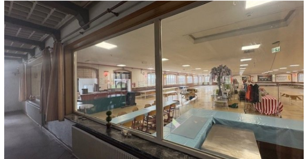
W Gastro 1