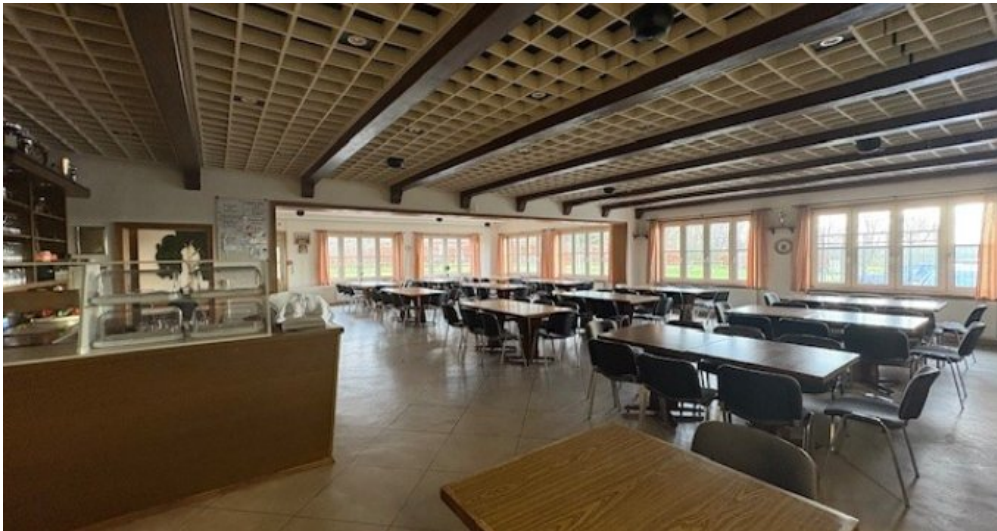
W Gastro 2