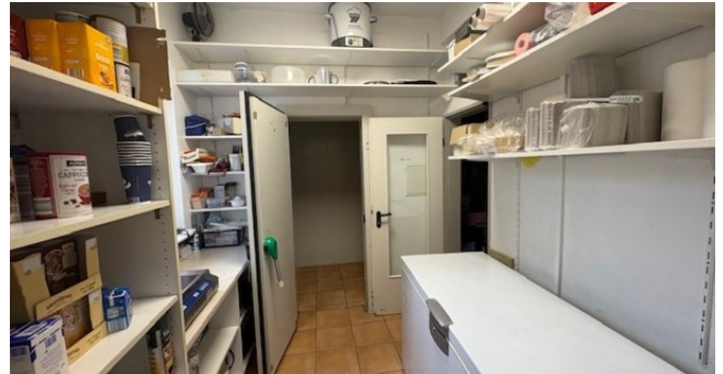
W Lager Küche