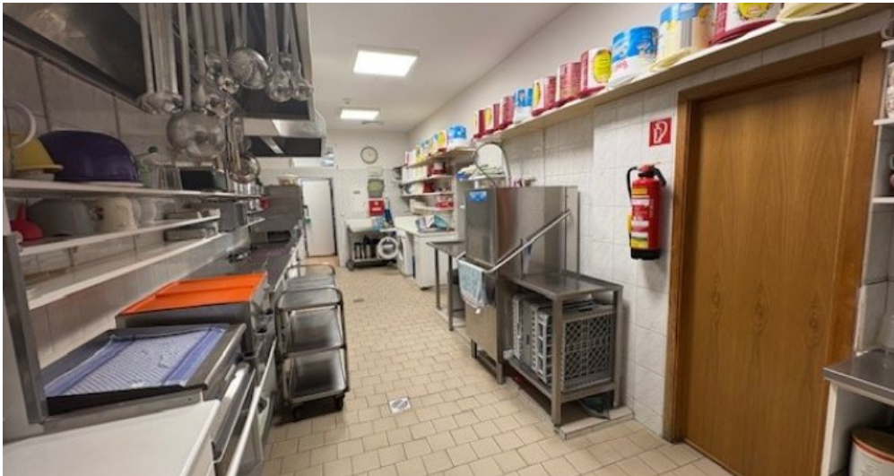
W Küche 2