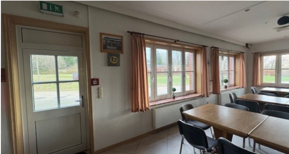
W Gastro Zugang