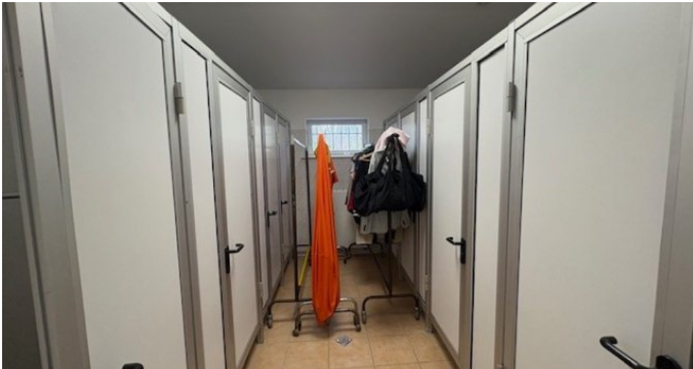
W Sanitär female