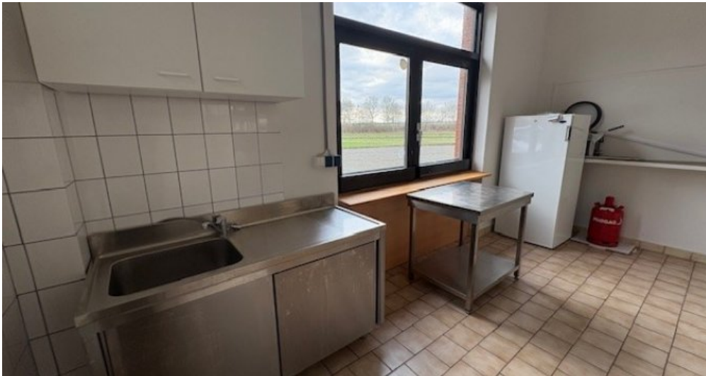
W Küche Foyer