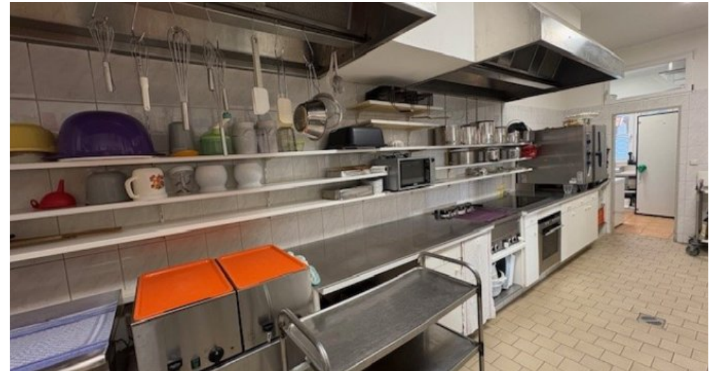
W Küche 3