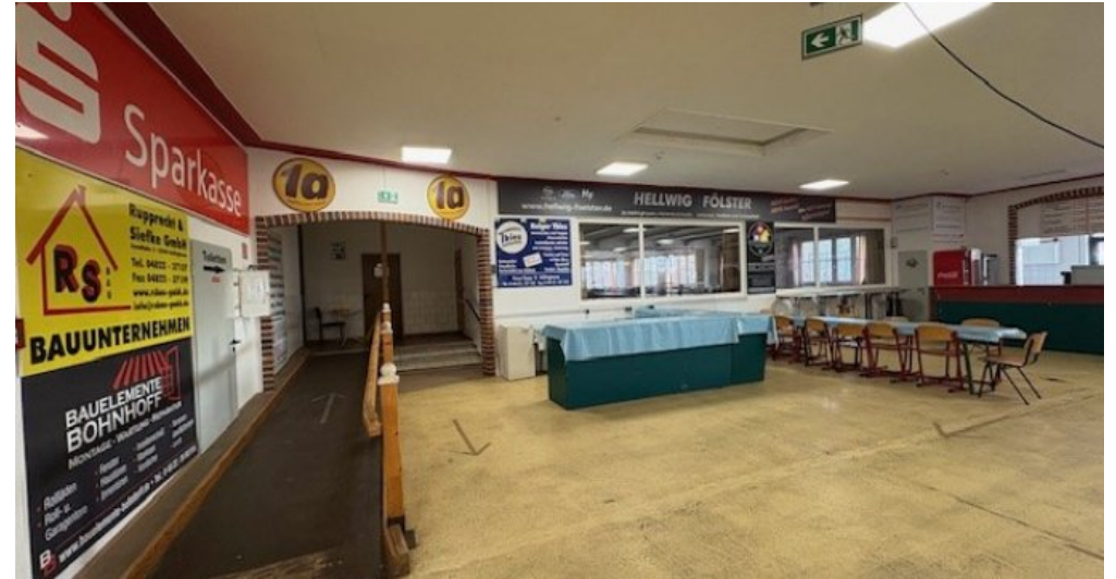
W Halle Innen Rampe