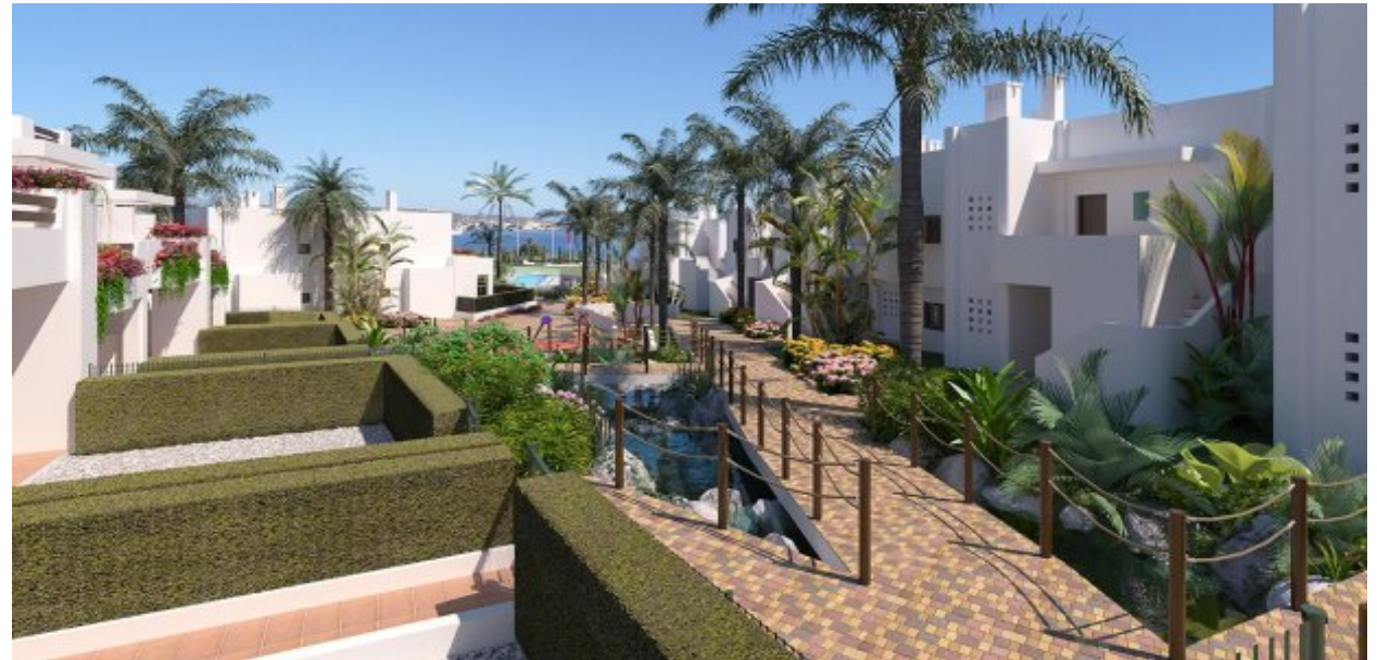
Der Stil der Einrichtung ist wählbar.