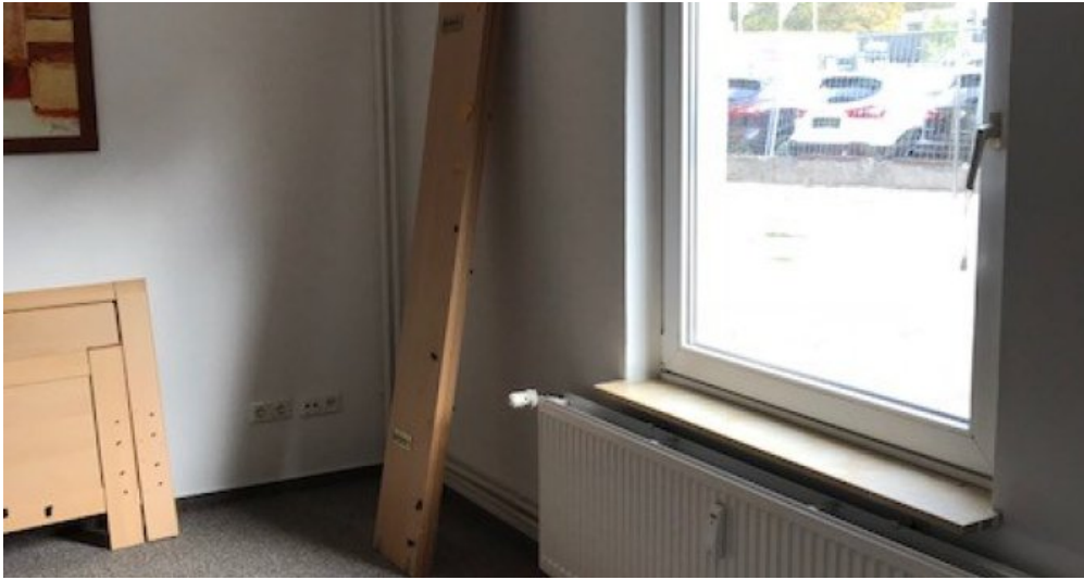
EG links Hinterhaus Zimmer