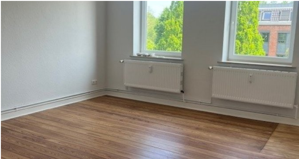
2. OG rechts Wohnzimmer