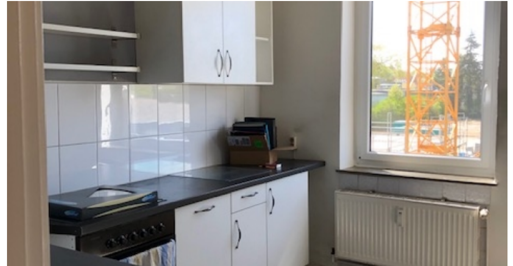
2. OG links Küche