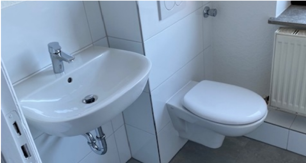
1. OG rechts Badezimmer