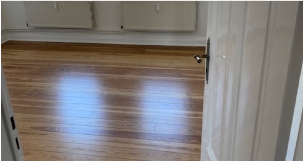
1. OG rechts Zimmer