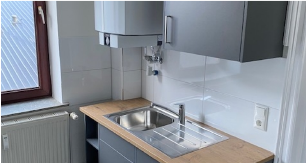
1. OG rechts Küche