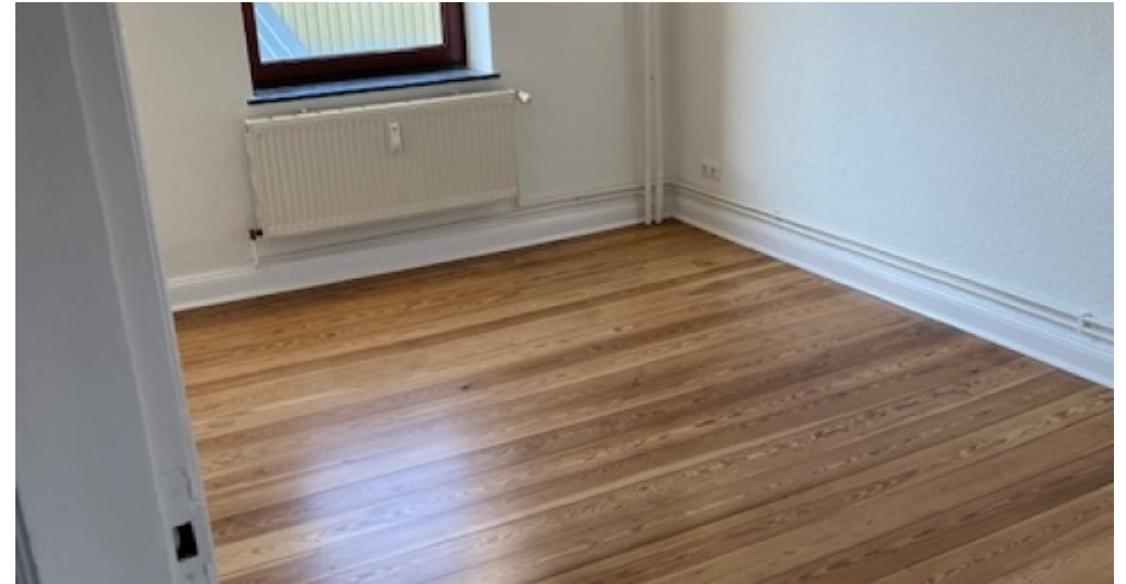
1. OG rechts Zimmer