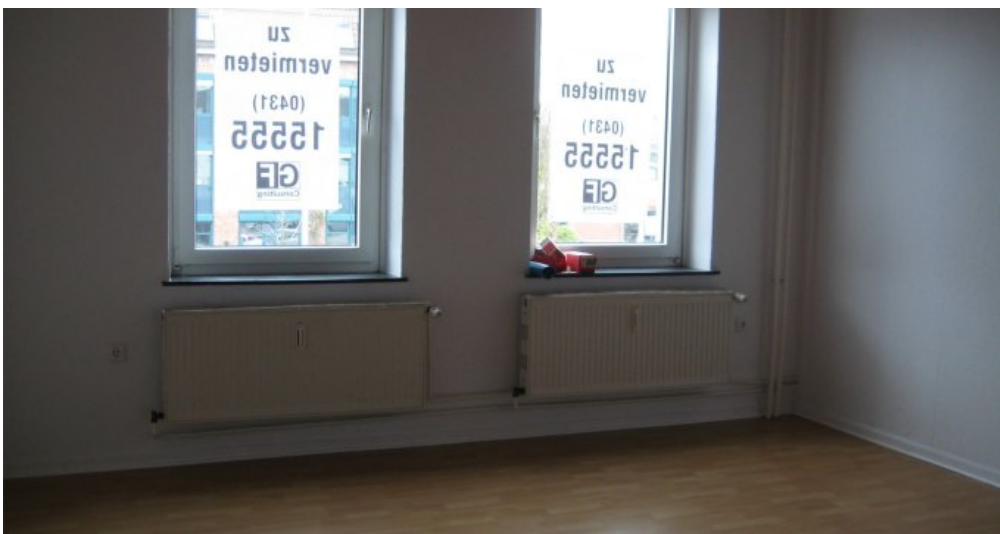
1. OG links Zimmer