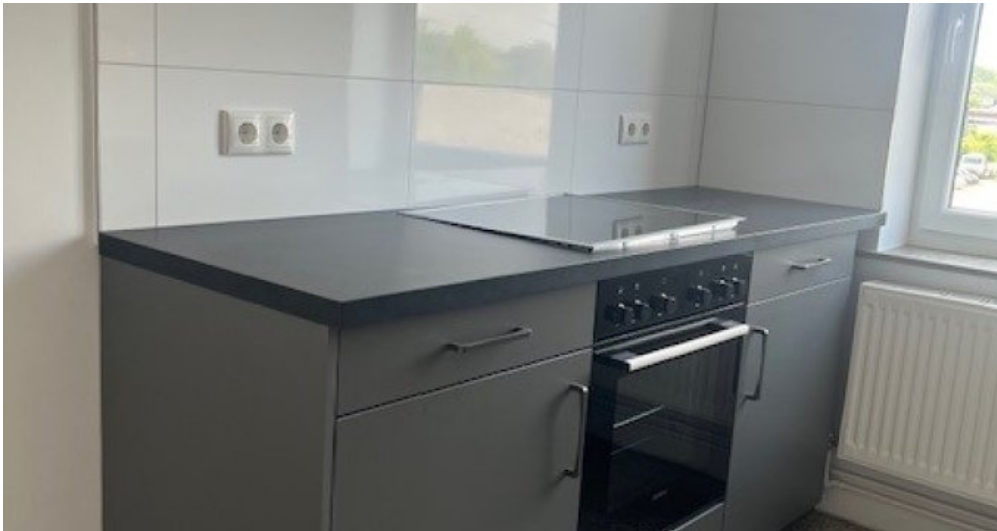
2. OG rechts Küche