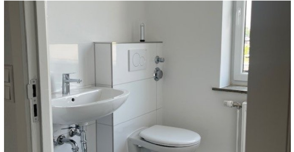
2. OG rechts Bad