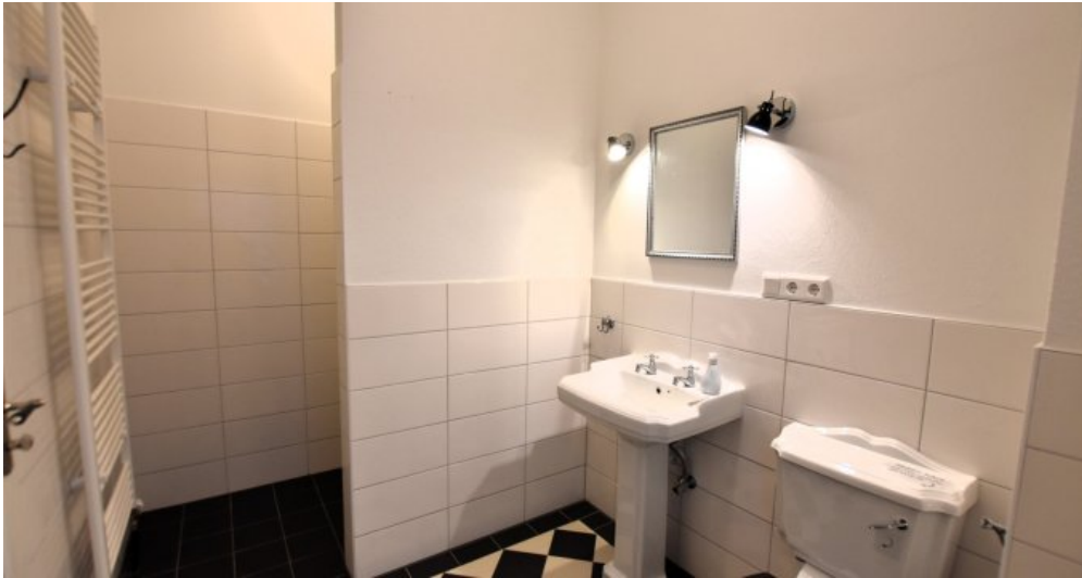
EG Gewerbe Dusch-Bad