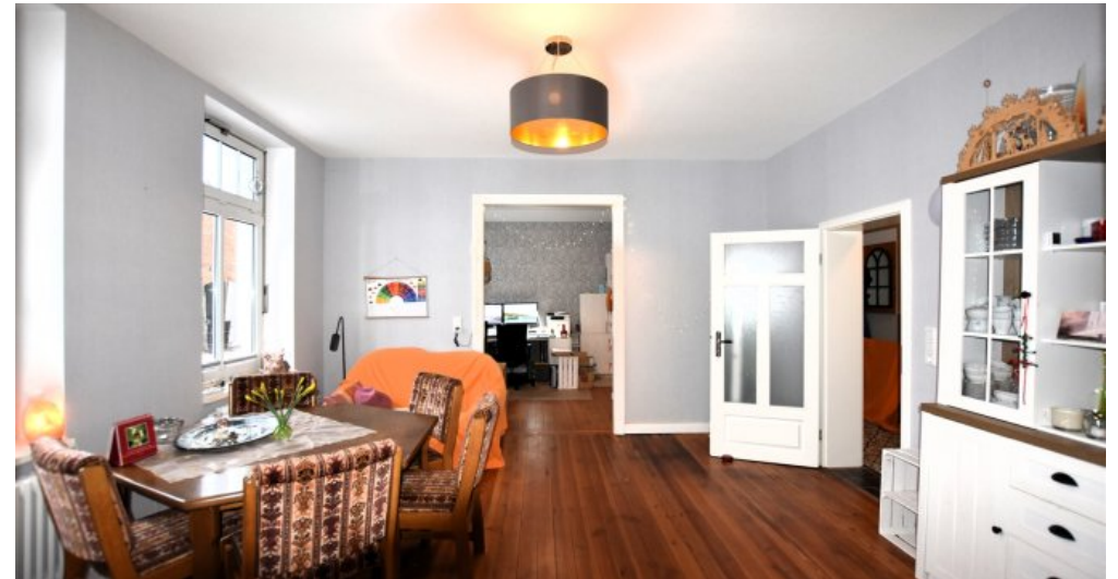
EG Gewerbe Raum 1