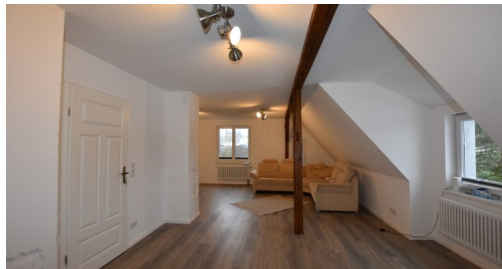
OG großer Raum weitere Ansicht