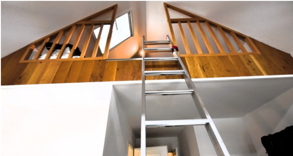
OG Koppelzimmer Zugang Schlafb