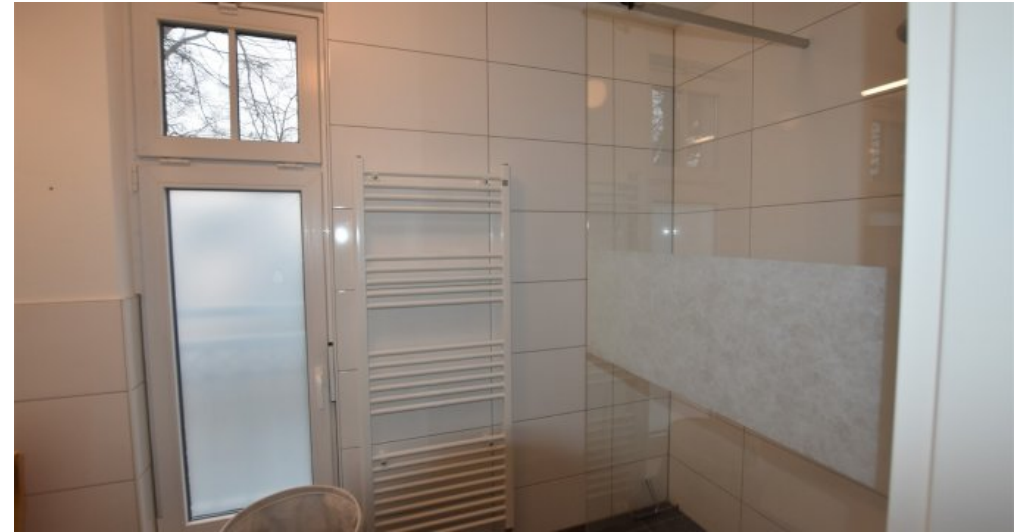
OG Koppelzimmer Bad