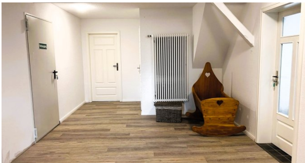
OG Wohnen Diele