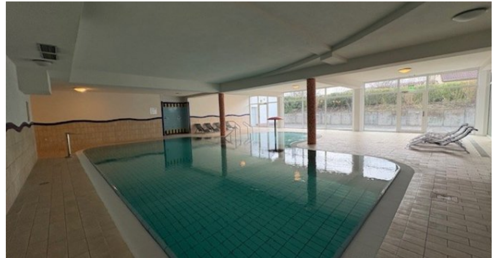
Weitere Ansicht Schwimmbad Mirow