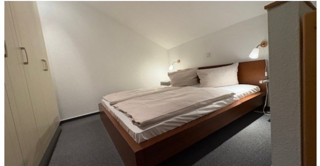
SZ Mirow 2. Ansicht