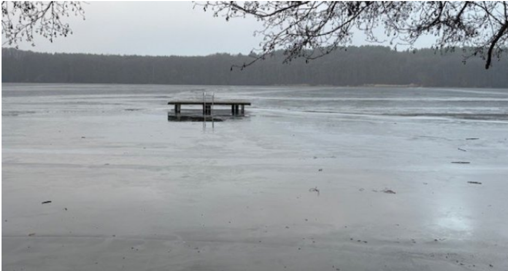
See 2 Mirow