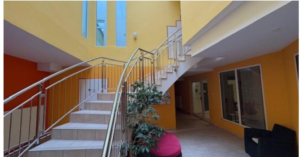
Foyer Mirow Untergeschoß