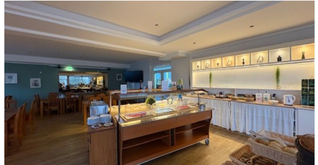
FS Bereich Mirow