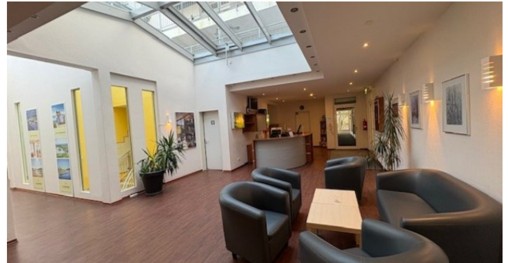
Foyer Mirow Eingangsbereich