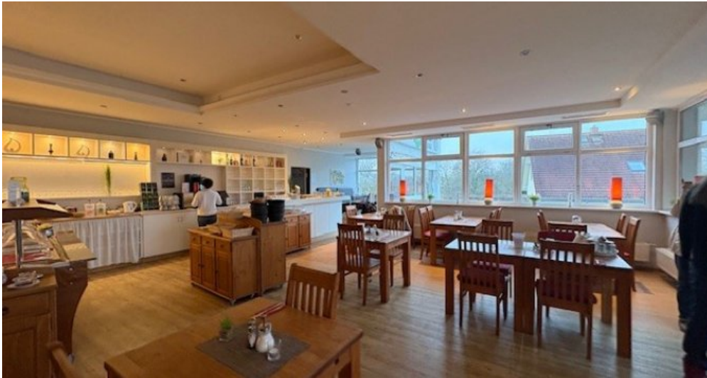
FS 2 Mirow