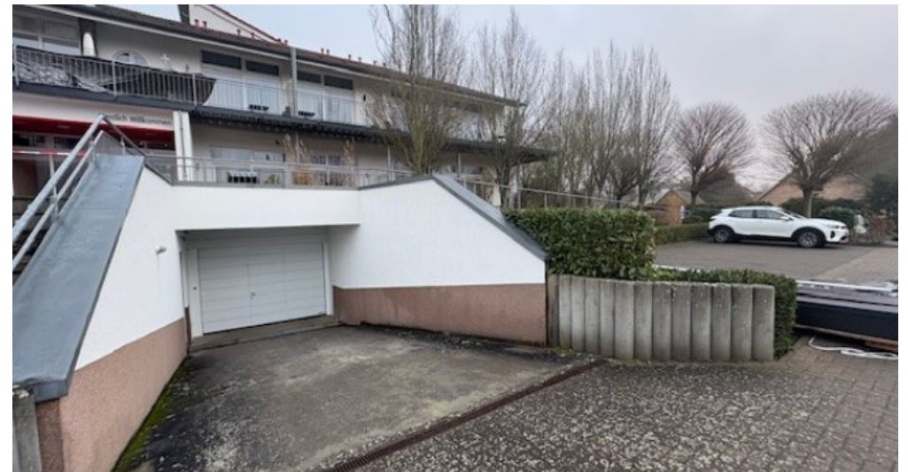
TG Ansicht Mirow