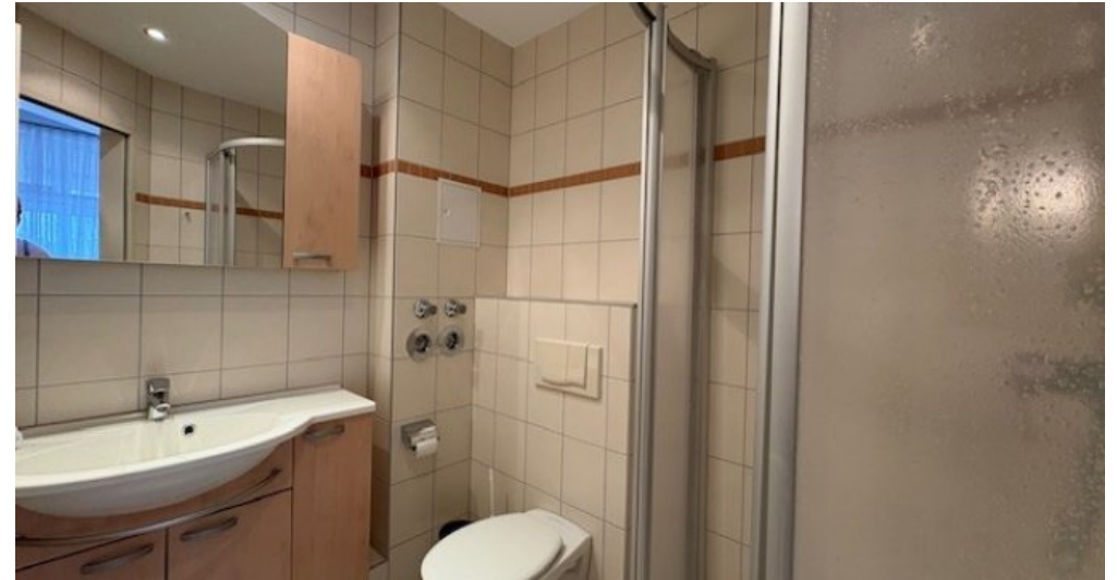
Duschbad Mirow weitere Ansicht