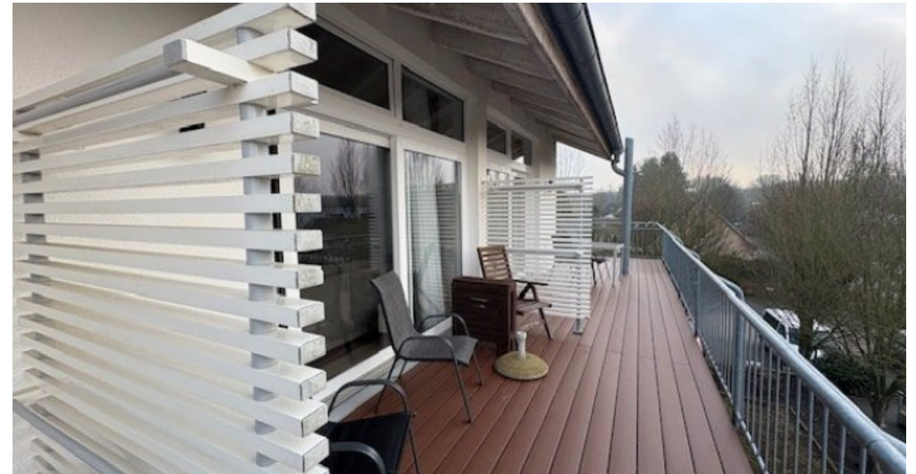
Ausblick 2 Mirow