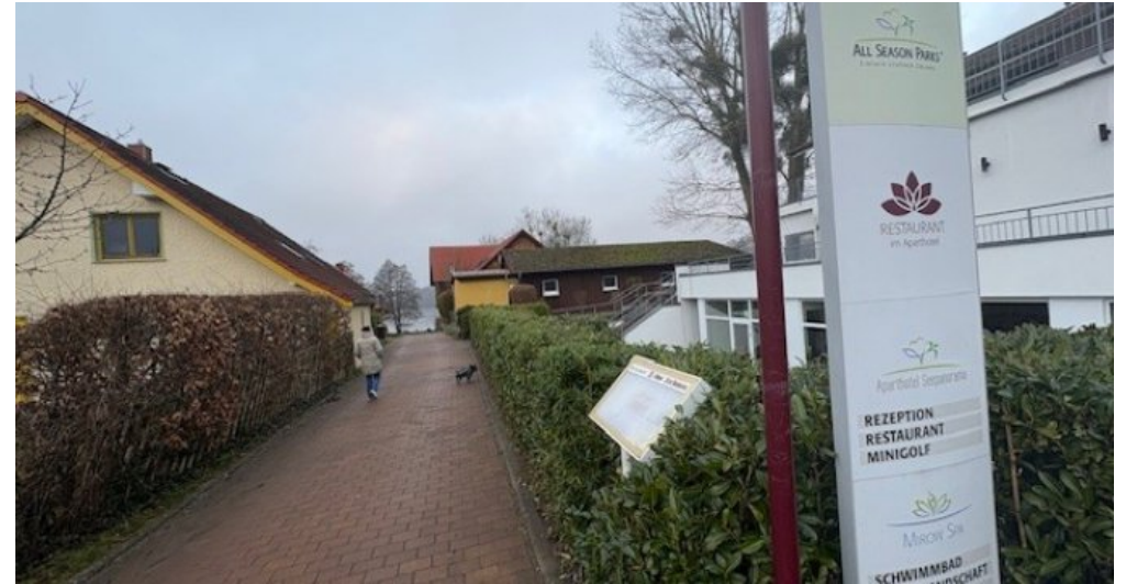
Mirow Weg zum See