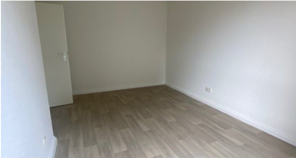
ES 13 Zimmer 2. Ansicht