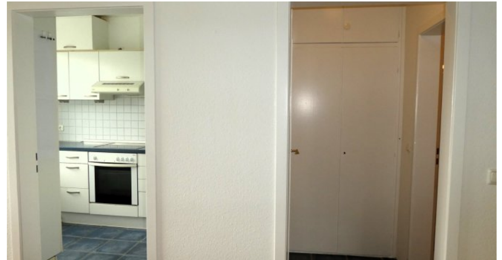
Einbauschranks vor dem Bad