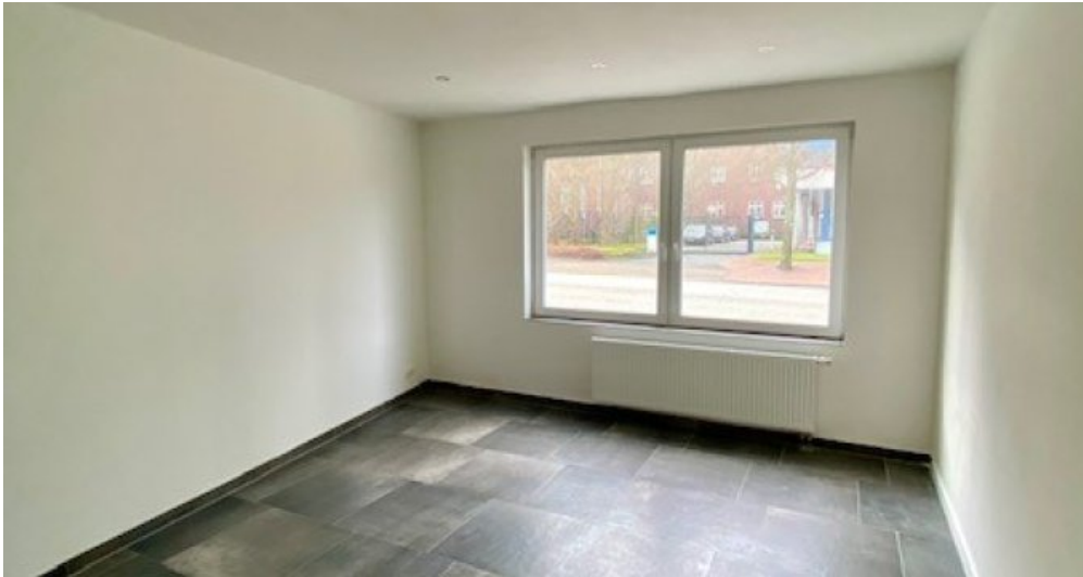
GP zweites Kinderzimmer