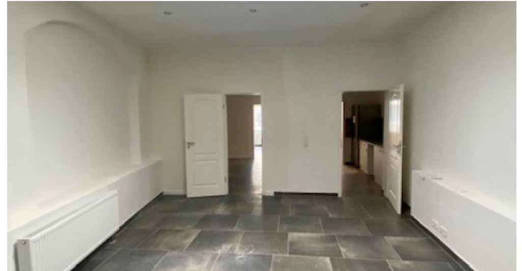
GP Schlafzimmer 2. Ansicht