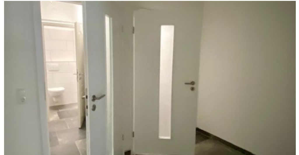
GP Flur vor dem Bad und WC