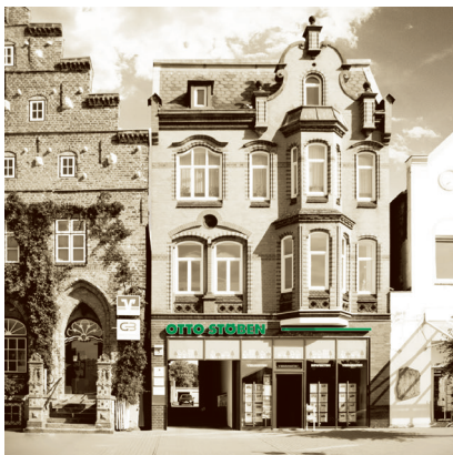
BÜRO HUSUM Markt 5

Zwischen Deich und Schafen in der grauen Stadt am Meer liegt unser Regionalbüro Husum direkt am betriebsreichen Marktplatz. Hier in unserem Regionalbüro bieten unsere Mitarbeiter seit 2009 alle Leistungen an Maklertätigkeiten. Hierzu gehören der Verkauf und die Vermietung von sowohl Wohn- als auch Gewerbeimmobilien und Kapitalanlagen, die Bewertung und Gutachtererstellung sowie die Verwaltung von Immobilien inklusive der WEG-Verwaltung.