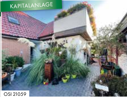
BÜRO NEUMÜNSTER Mühlenbrücke 8

Wir beraten Sie umfangreich und kompetent!