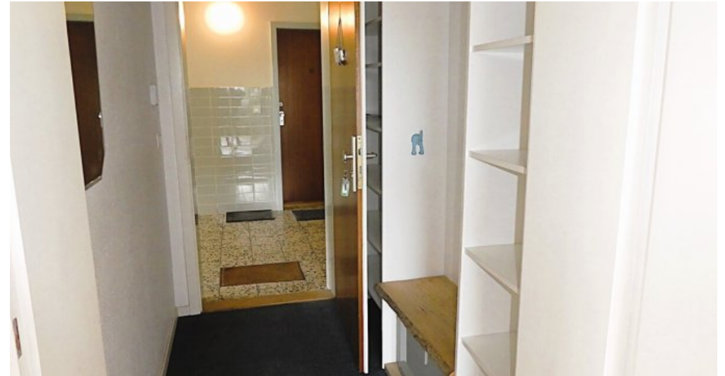
Flur mit Garderobe