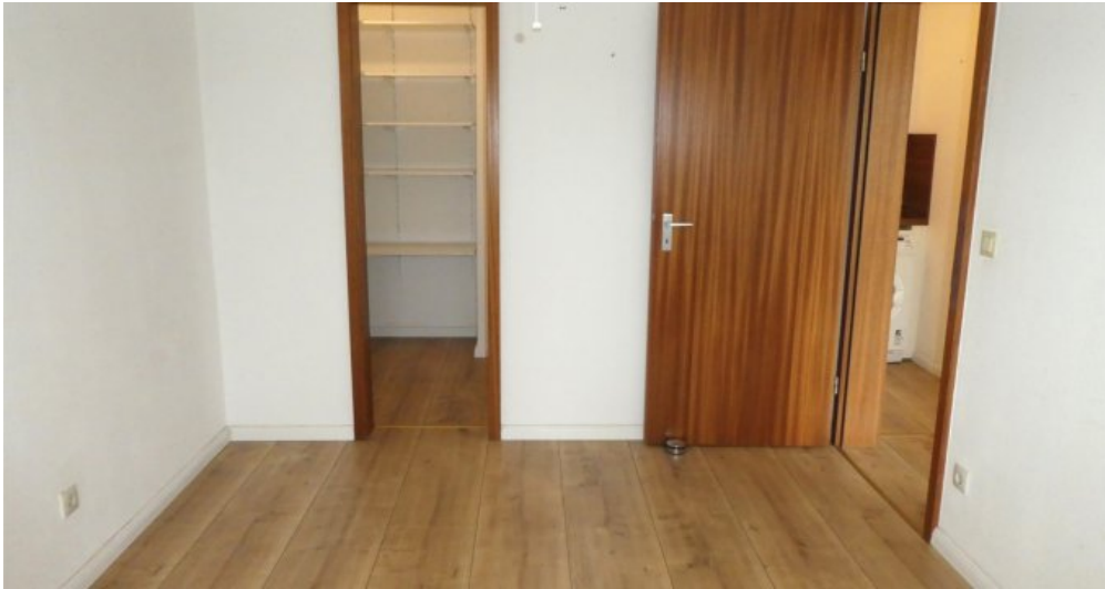
Schlafzimmer mit Abstellkammer