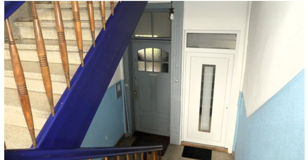
Eingang Whg links