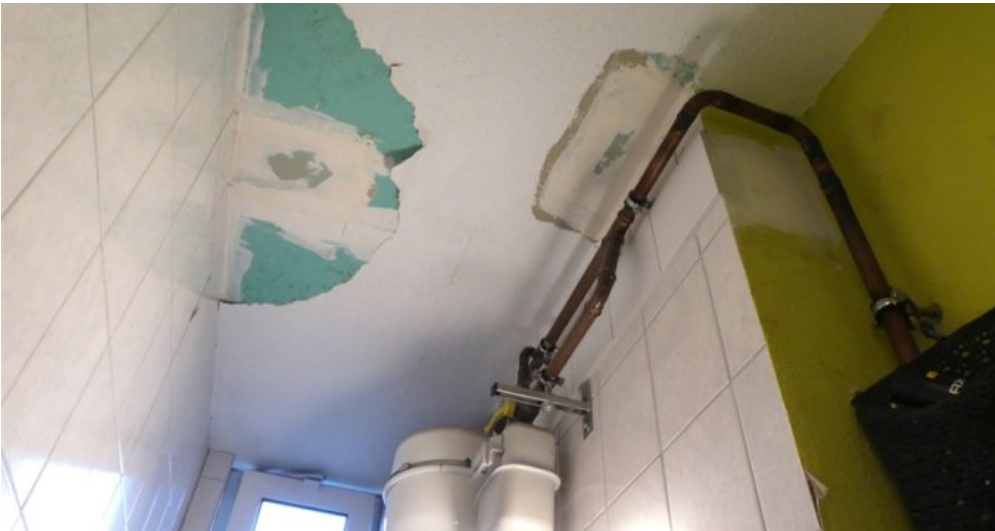
Duschbad alter Wasserschaden