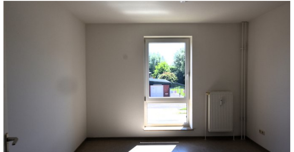
GBR Musterfoto Schlafen