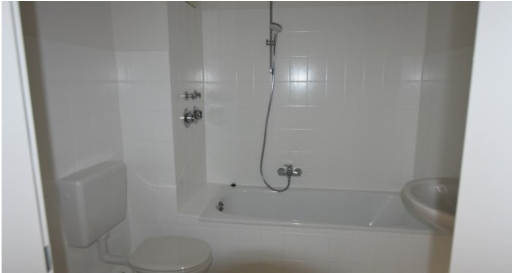
GBR 34 1 OG rechts Bad