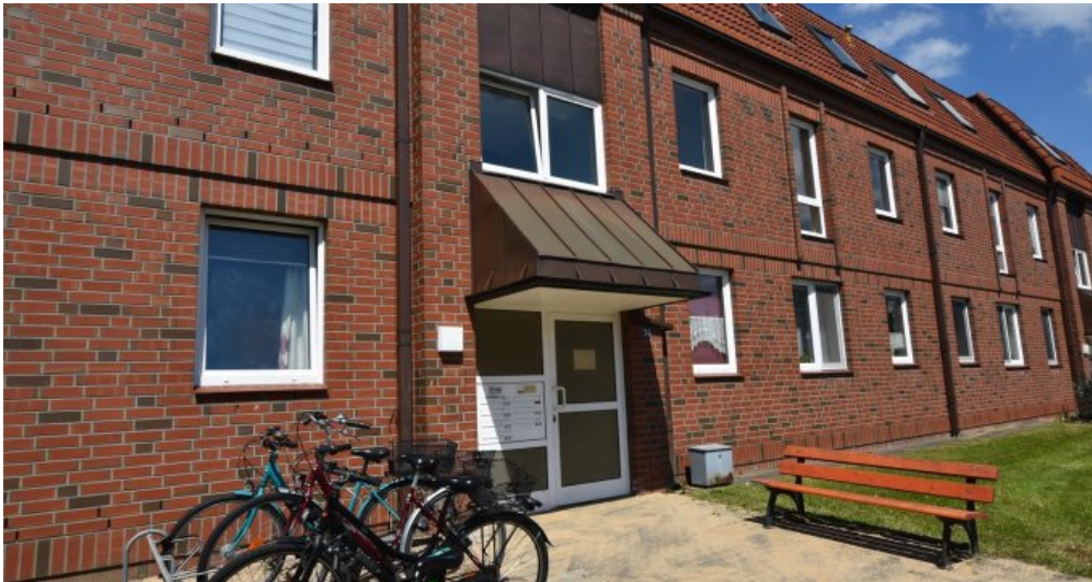
GBR 34 1 Hauseingang