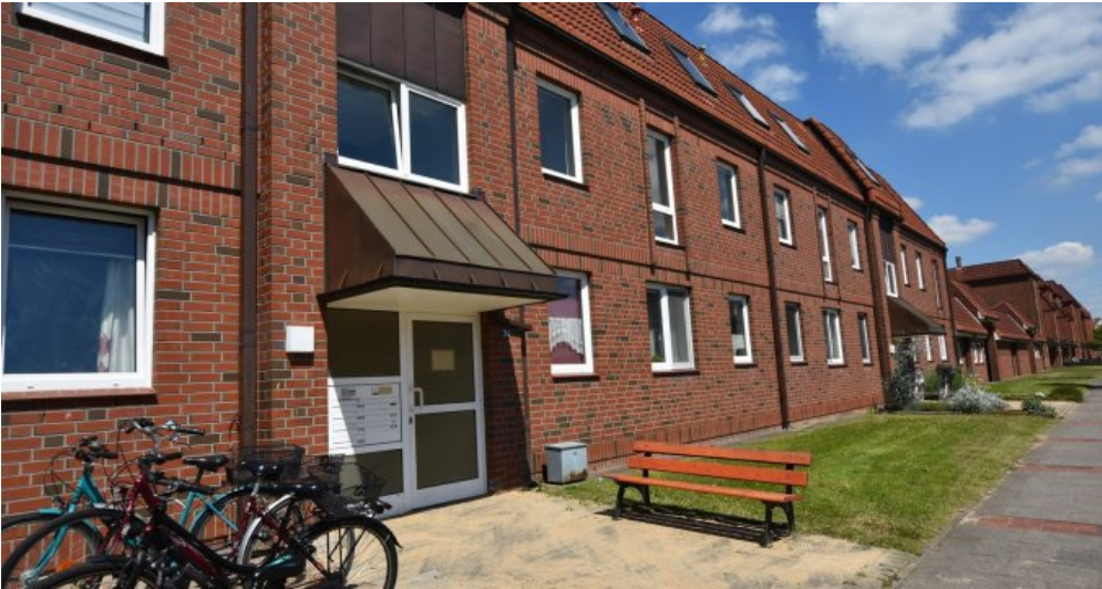
GBR 34 Straße