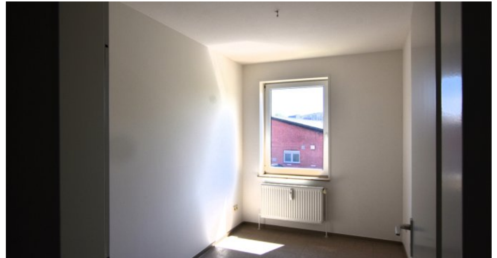
GBR 34 1 OG rechts, halbes Zim