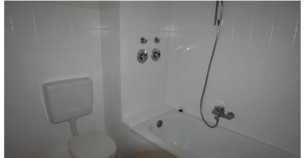
GBR 34 1 OG rechts Bad (2)