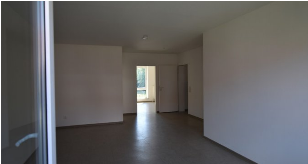
GBR Musterfoto Wozi (4)