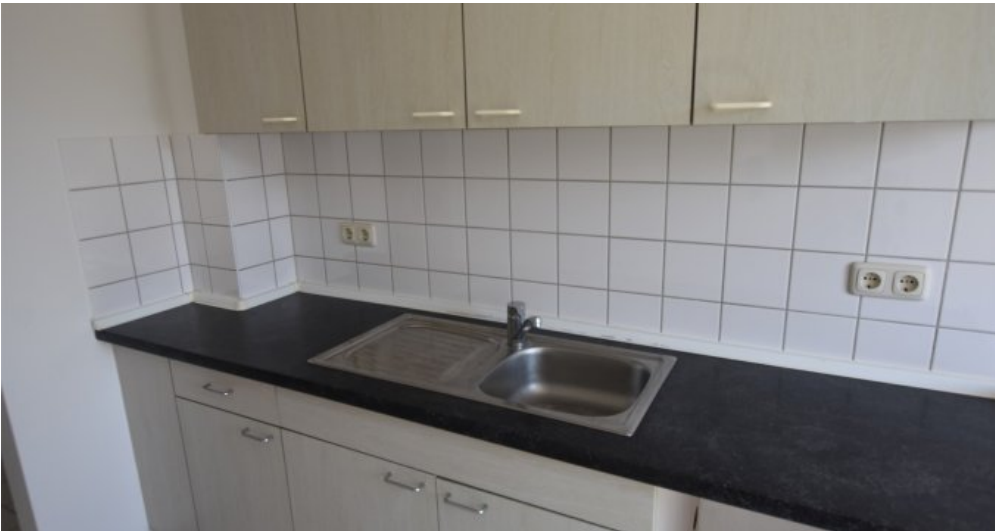
GBR 34 1 OG rechts Küche (2)