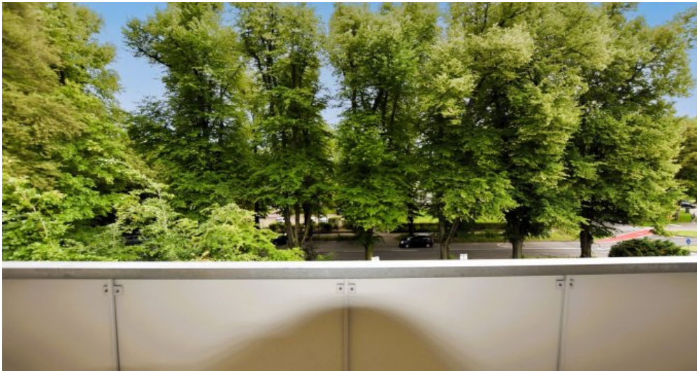
Ausblick vom Balkon