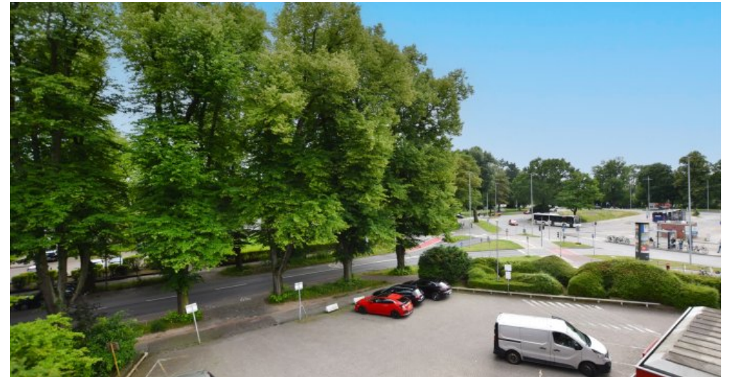
Ausblick Richtung GRP