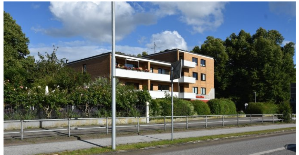
Ansicht von GRP