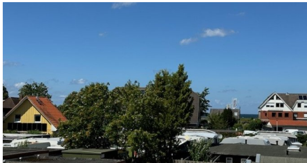
Blick zum Wasser