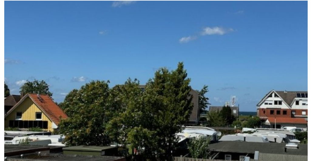
Blick zum Wasser