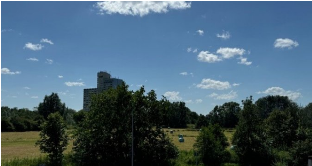
Blick Richtung Holm