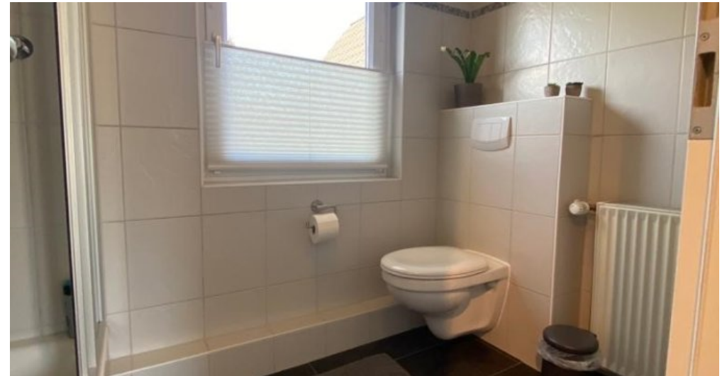
Duschbad Obergeschoss 2. Ansicht