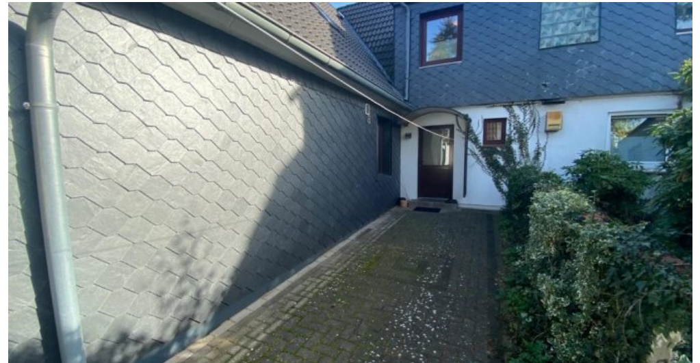
Zugang zum HWR