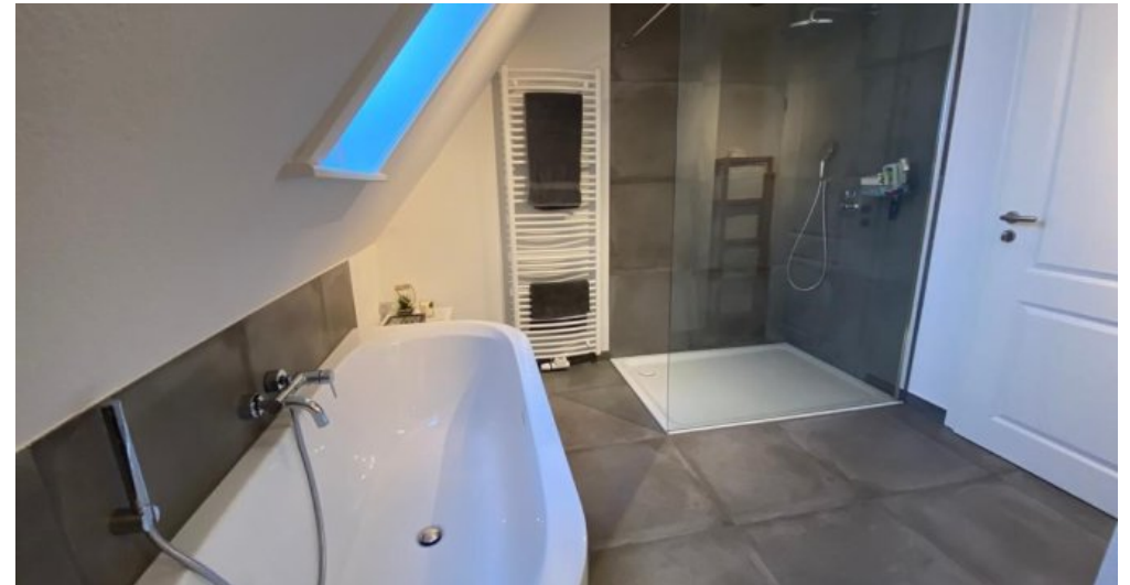
Masterbad 2. Ansicht