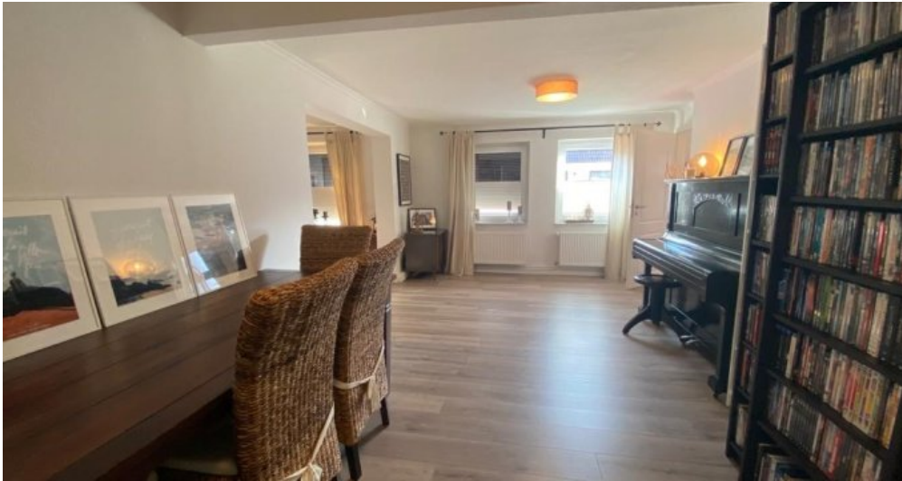
Esszimmer 2. Ansicht