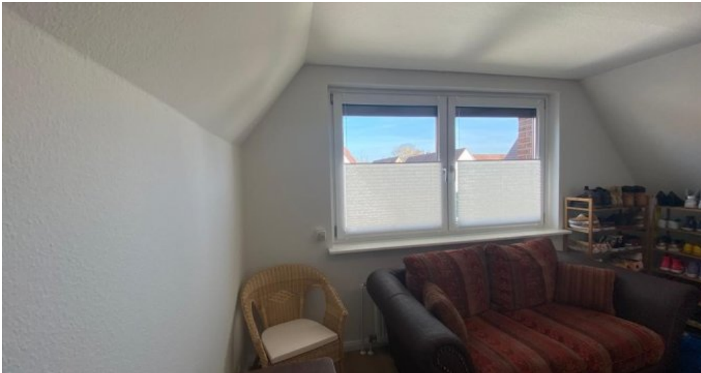
Zimmer Obergeschoss 2. Ansicht