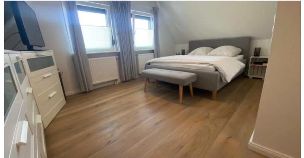
Schlafzimmer 2. Ansicht