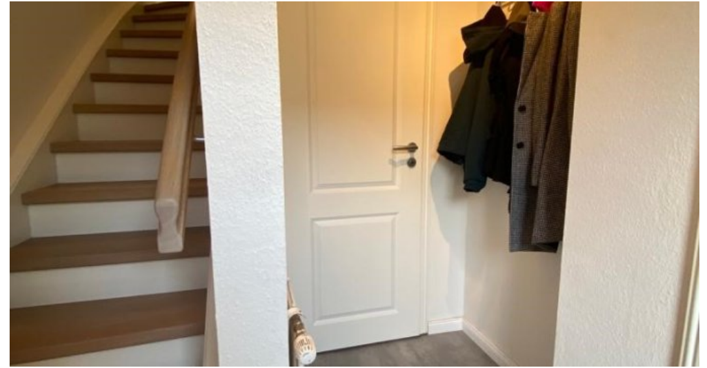
Garderobe Blick zum Gäste WC