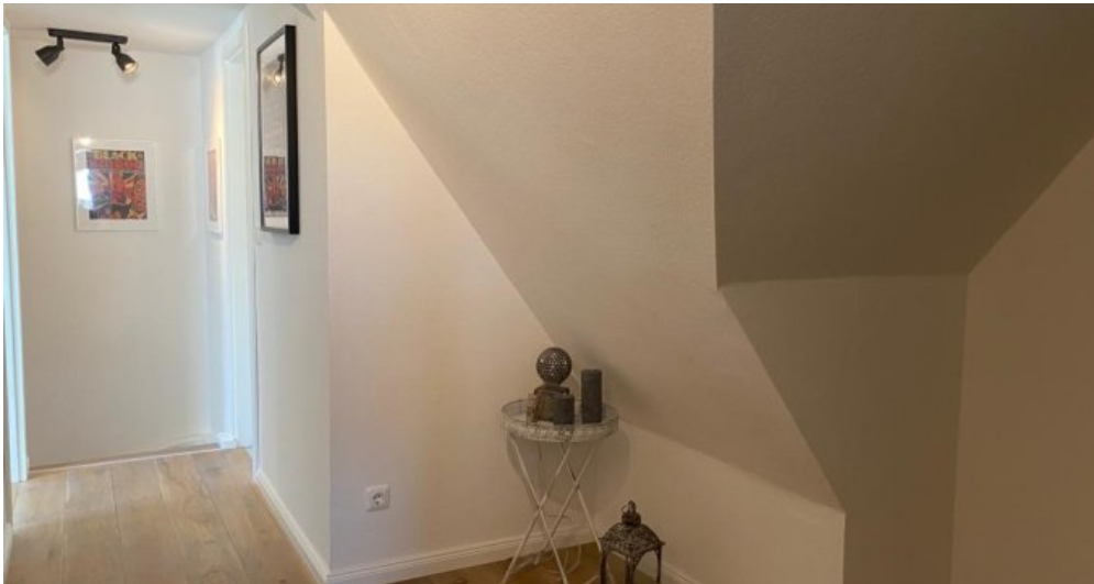
Flur Obergeschoss 21157