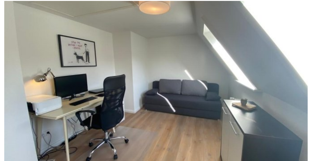
Arbeitszimmer Obergeschoss 2.