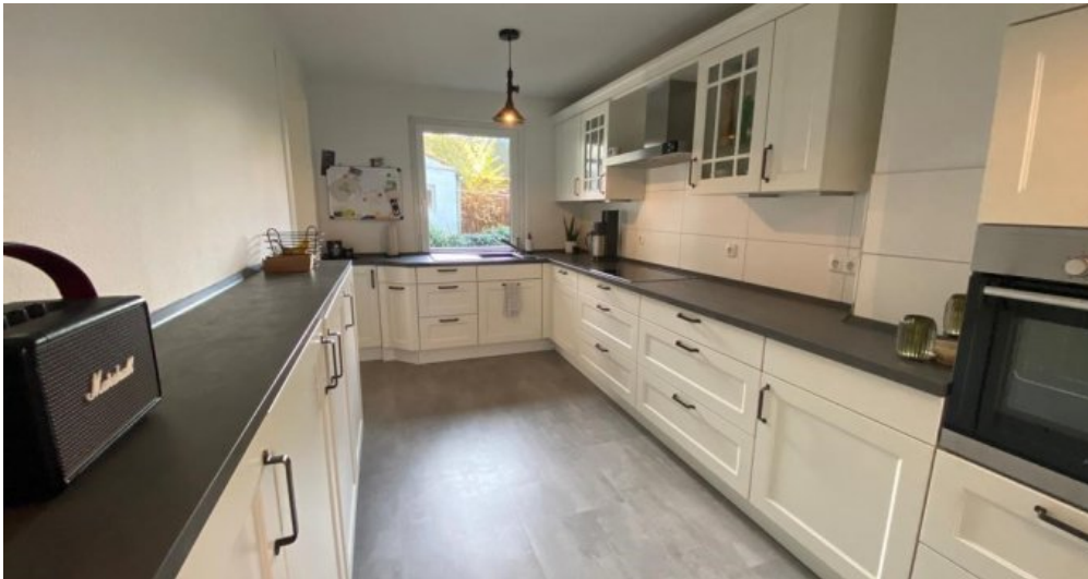
Küche 2. Ansicht