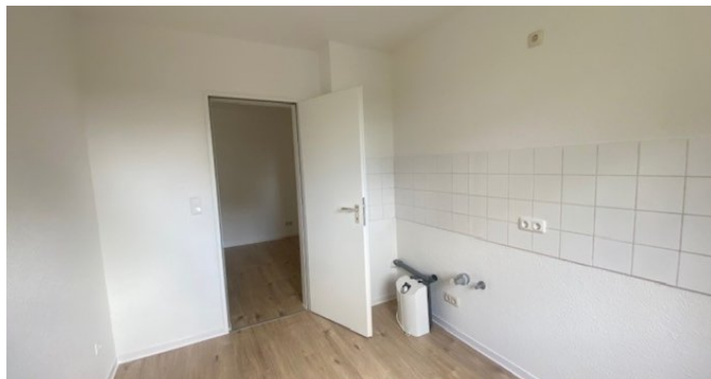
Küche weitere Ansicht