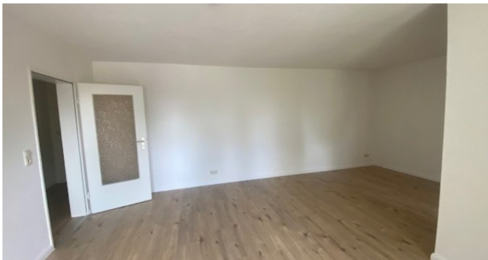
Wohnzimmer weitere Ansicht2