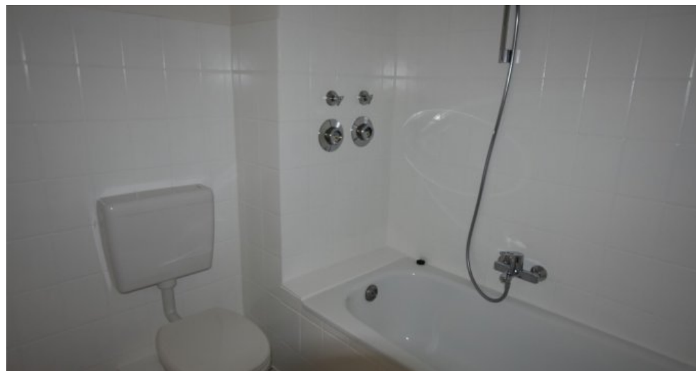
GBR 34 1 OG rechts Bad (2)