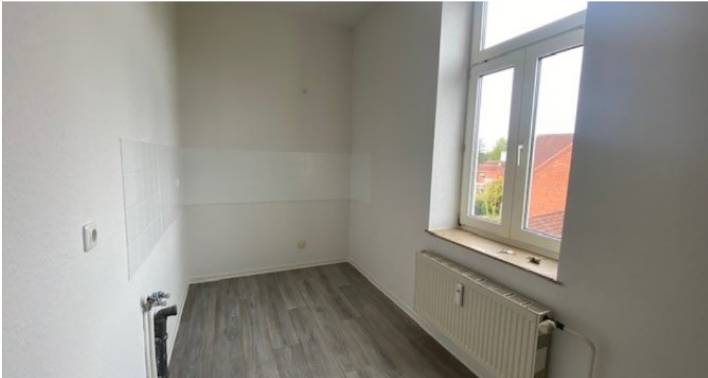
Festge 2 Küche