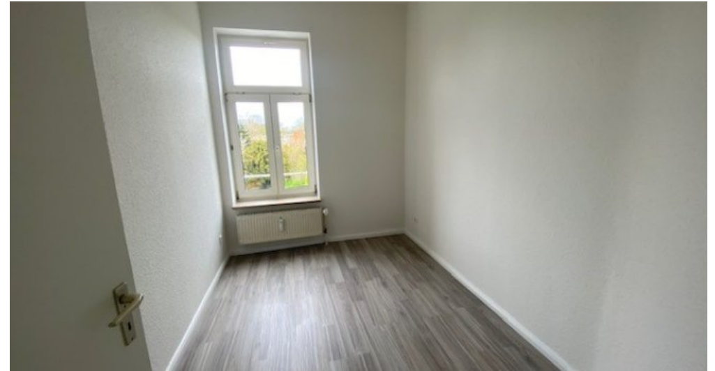
Festge 2 halbes Zimmer