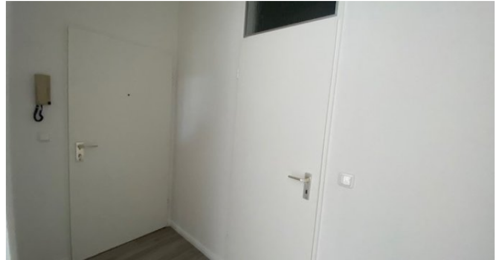
Festge 2 Flur