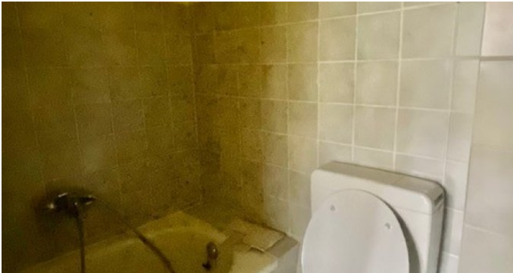
Kanal 13 Bad weitere Ansicht