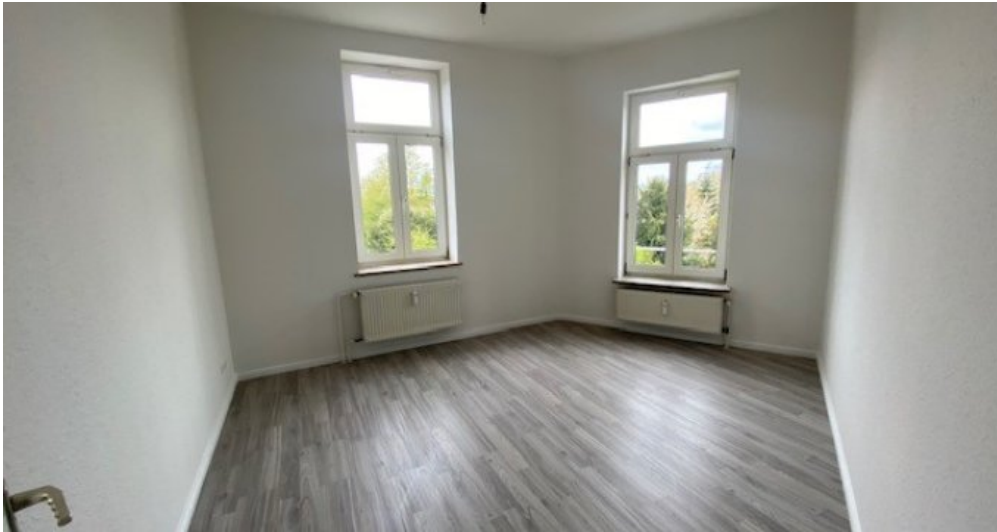
Festge 2 ein Zimmer