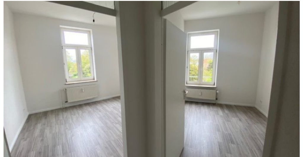
Festge 2 zwei Zimmer