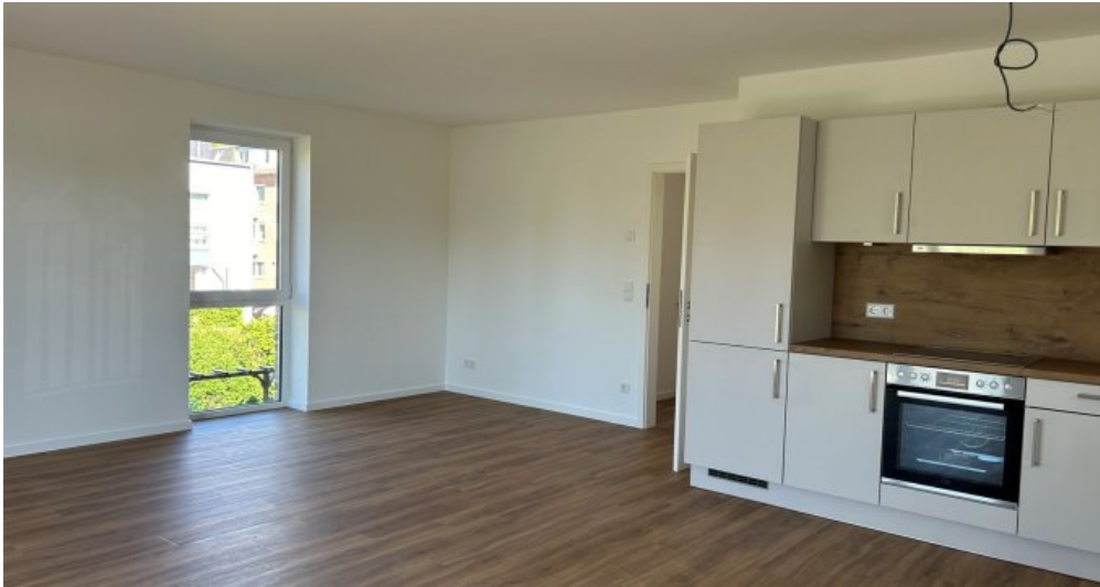
Wohnbereich mit integrierter K