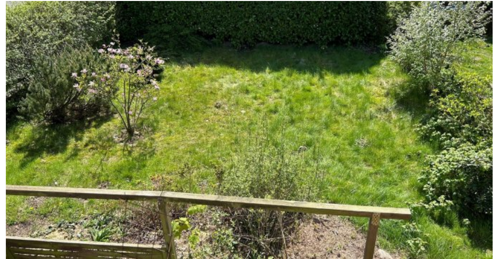
Blick in den Garten