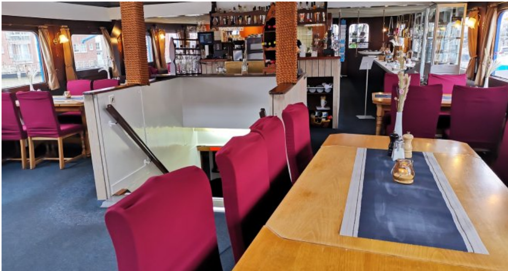
Sitzplätze an Bord