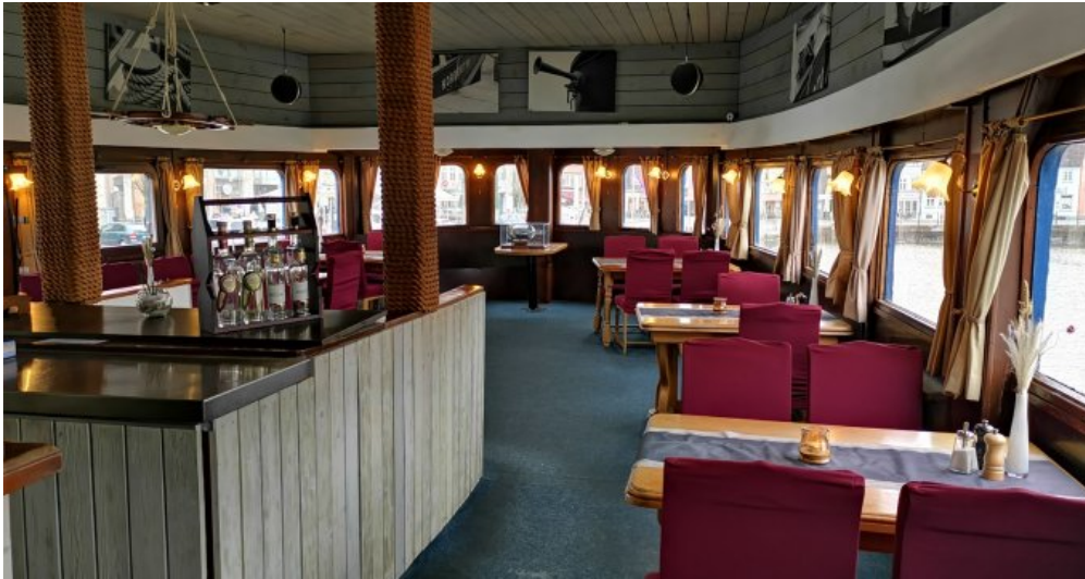
Sitzplätze an Bord