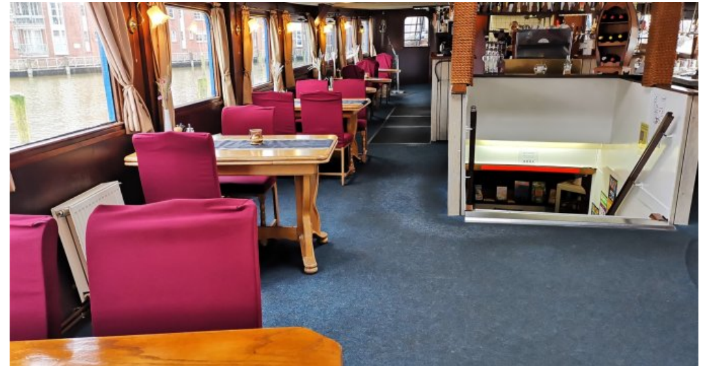
Sitzplätze an Bord