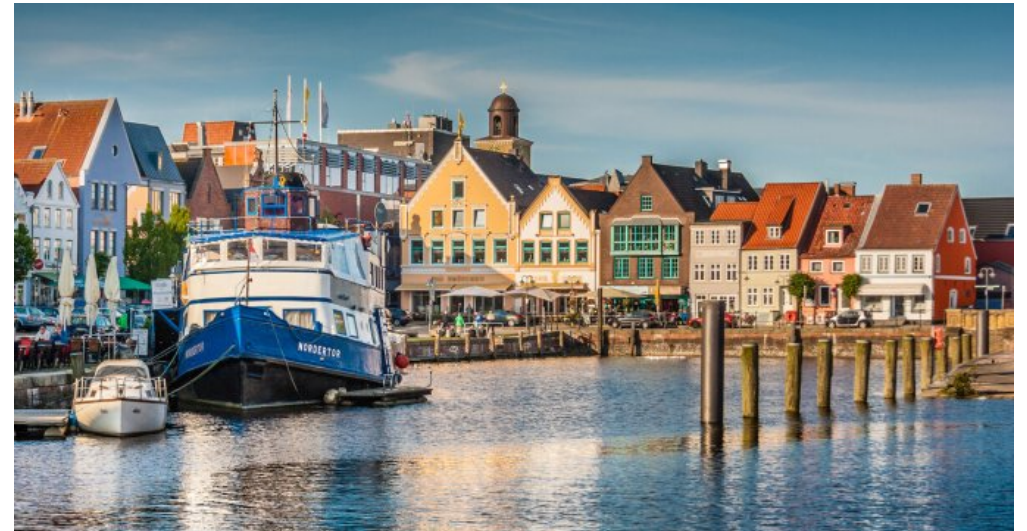
Nordertor mit Hafen